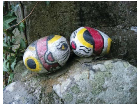
銀の道沿線に置かれた「福石猫」