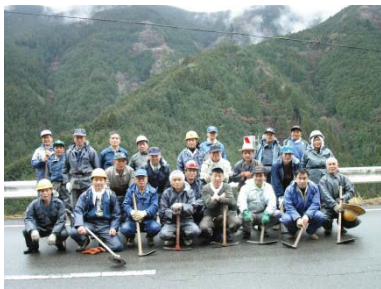
柳谷壮年会メンバー

柳谷 やなぎだに 壮年会が、平成15年から取り組んでいる事業で、5万本のさくらを地域内に植樹し、50年後に日本一のさくらの里とすることを目指しています。桜の苗木は、しっかり伸びるように種から育て、2年ほどで植樹できるようにしています。種蒔き、苗畑づくり、除草下刈りなどの作業は、90人の壮年会メンバーだけでなく地域の方々も積極的に参加し、一年一年桜色に染まる山が広がっており、地域ぐるみで「さくらの里づくり」を進めています。