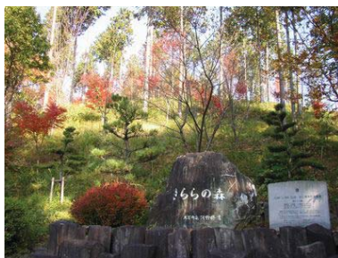
きららの森(森づくり)

道路からの眺望を良くするために道路沿いの立木(スギ、ヒノキ、雑木など)の一部伐採や、景観に配慮した森づくりを行っています。また、道路沿線の美化活動を定期的に行っており、訪れる人々が気持ちよく美しい自然資源を満喫できるよう景観を整備しています。