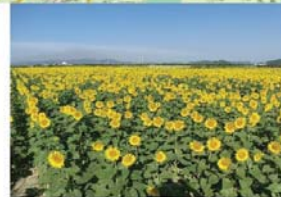
笠岡市【干拓地とひまわり】