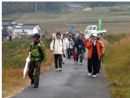
銀の道スーパーガイドの育成