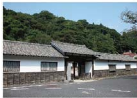
大田市【大森代官所跡】