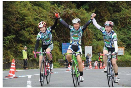
石鎚山ヒルクライム レース状況