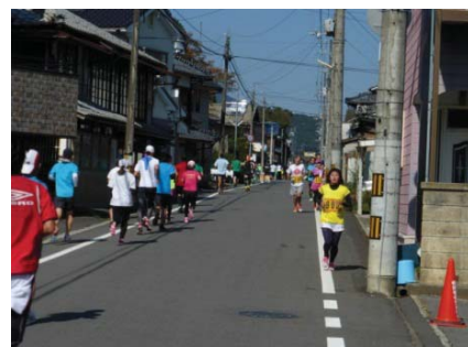
マラソン大会 レース状況