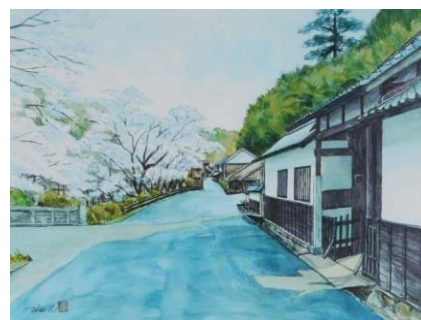
2月 早春の代官所跡(大田市)