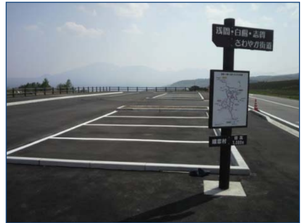
設置状況「簡易駐車場(ビューポイント)」