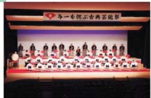
井原市【与一を偲ぶ古典芸能祭】