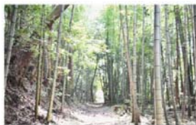
美郷町【十王堂付近竹林】