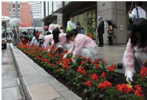
合同植栽(国道4号“三越本店前”)

平成24年10月に開催した全国サミット「風景街道サミットinあさま」をきっかけに、東京日本橋で活発に活動している“江戸・東京・みらい街道”と合同植栽活動を計画しました。当街道内の群馬県立中之条高校の生徒が育てたサルビアの花苗を提供し、日本橋での合同植栽に参加することによって、社会貢献、世代間交流、地域交流を通じて、人材育成、意識の醸成、活動の活発化が図れるとともに、活動のPRを行いました。