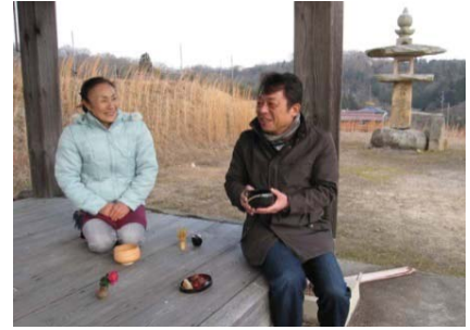
「辻堂」を活用した休憩・交流所