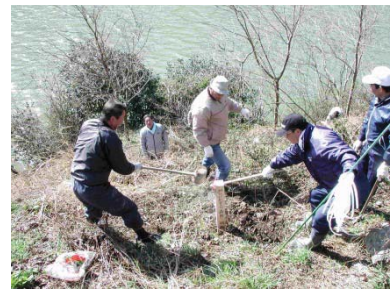
さくらの植樹状況