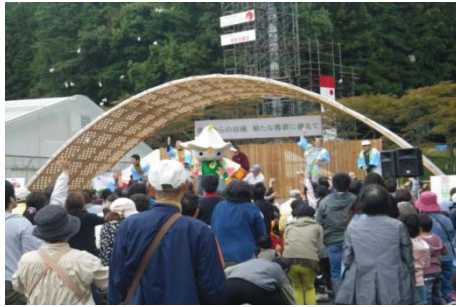
イベント広場の様子

中高生による吹奏楽や地域の伝統芸能発表など様々なイベントを行います。また、特産品の販売や各種団体によるバザーなどもあり、おまつり広場では、親子木工広場の開設や農林業の資料・機械の展示をしています。