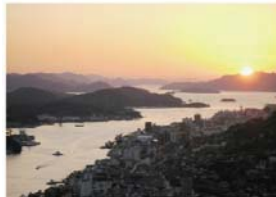
尾道市【浄土寺山展望台から】