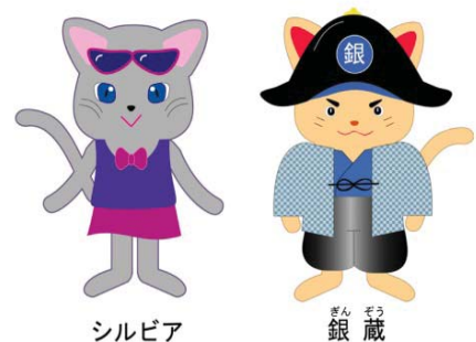
銀の道キャラクター

銀の道に素敵なキャラクターが登場しました。銀山奉行の家臣で銀山街道の整備や銀の輸送に関わった銀蔵さんと京都から東京銀座に移り住んだ渋めのファッションが好みのシルビアちゃんです。二人は猫に姿を変え時空を超えて飛び回ることができます。尾道市立大学の学生さんと銀の道ガイドの交流から平成24年に誕生しました。