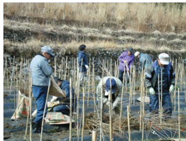
さくらの苗畑づくり