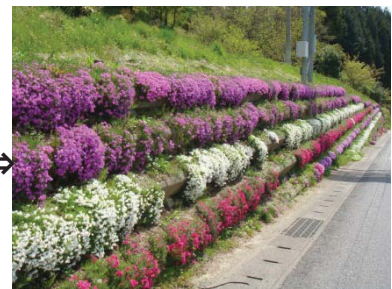
道路沿線の美化活動