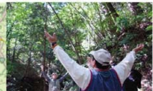
飯南町【森林セラピー】