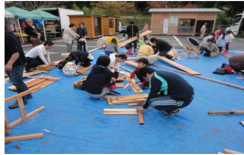
親子木材広場の様子