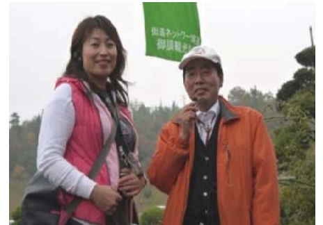
ワイヤレスヘッドセットを用いたご案内