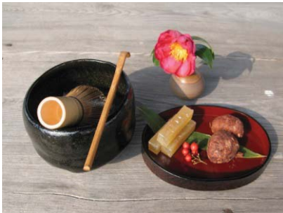
抹茶と百合の根を使った和菓子 のお茶会セット