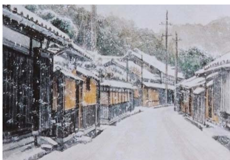
1月 冬の大森町並(大田市)