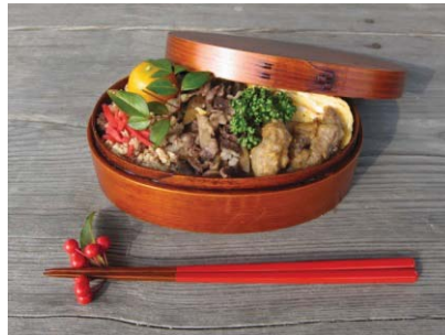
猪の天ぷらと山菜おこわ弁当