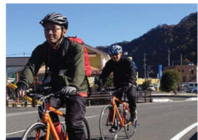
銀の道サイクリングイベント

サイクリングの聖地しまなみ海道を目指し、世界から大勢のサイクリストが訪れています。この賑わいを瀬戸内海から中国山地につなげていくために、銀の道沿線にサイクリストのための案内標識の整備やサイクリングイベントが広島・島根両県で検討されています。