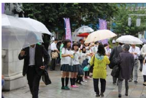
街頭PR(日本橋“滝の広場”)

将来の地域活性化を担う高校生と、地元のパートナーシップと一緒に東京日本橋へ行き、現地で同様の活動・志をもつ方々と合同で植栽活動を行うことにより、世代間交流や地域交流を深めました。