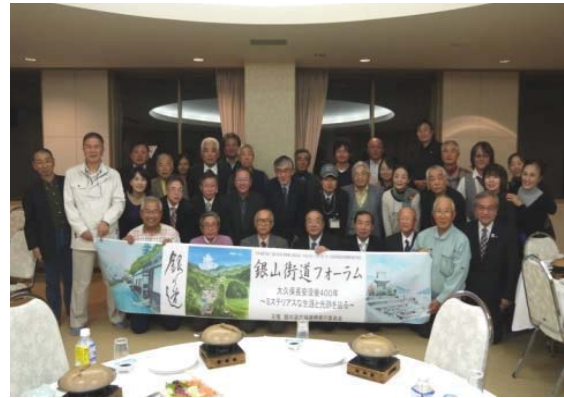
フォーラム後の交流会