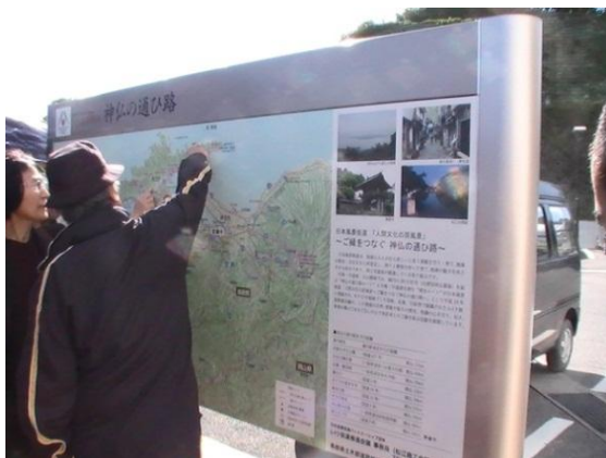
風景街道案内地図版（道の駅「本庄」）

道の駅の情報コーナーでは、風景街道のブースを設置して、湖水街道推進会議にて作成したガイドブックや、パートナーシップに参画する各団体や自治体の観光パンフレット等を配置し、日本風景街道として当地域をPRする取り組みを行っています。