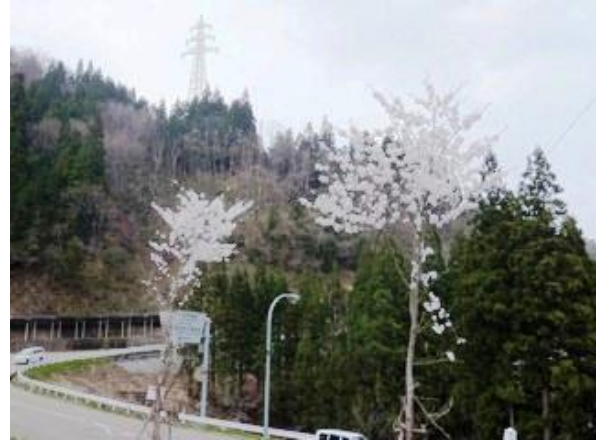
植樹活動後に開花した桜