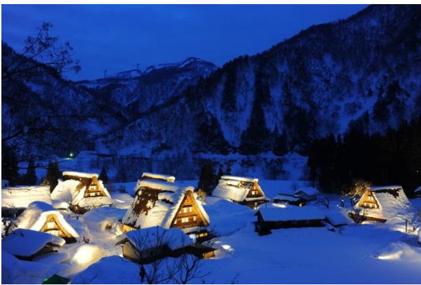
五箇山菅沼合掌集落