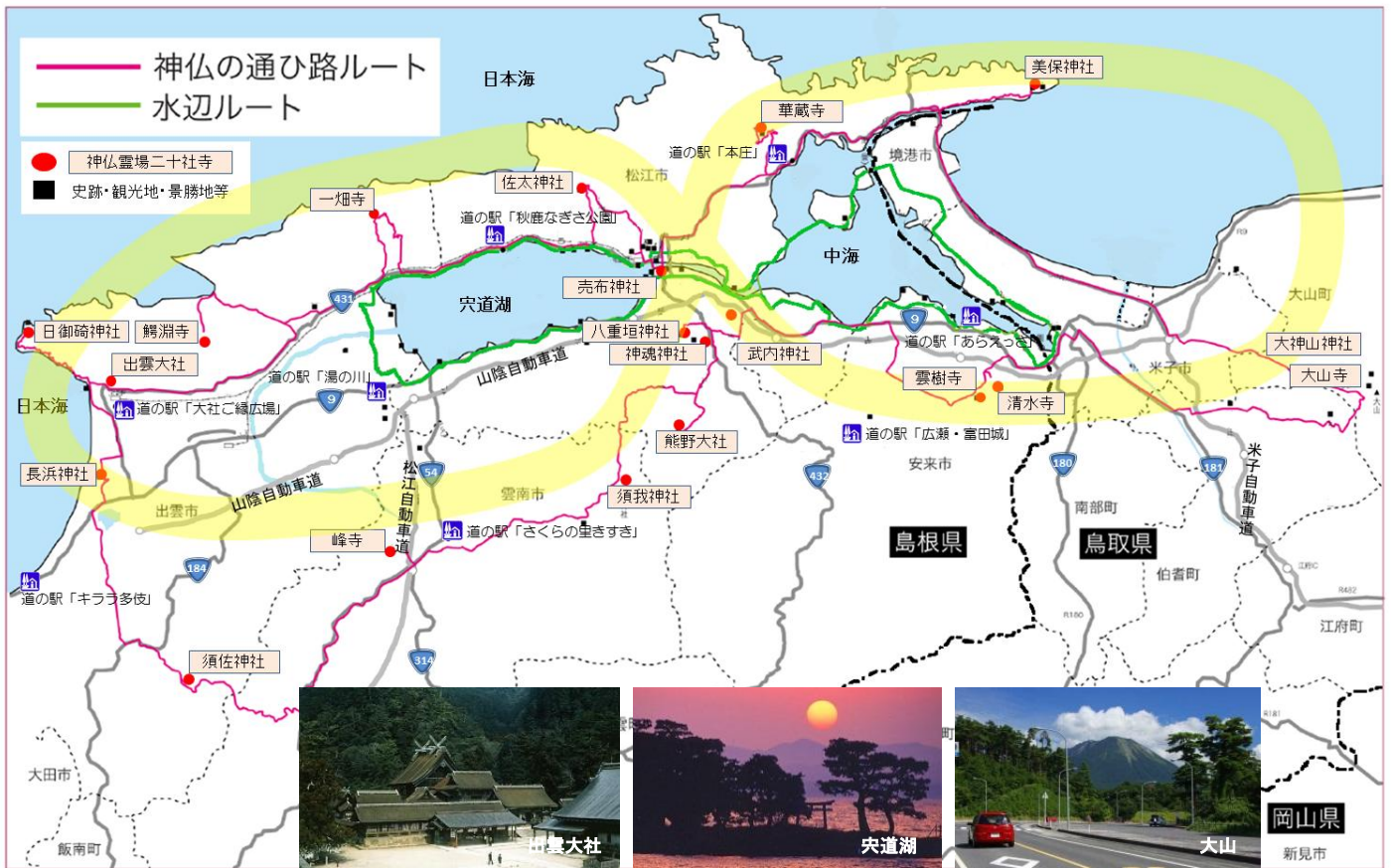
活動エリアとルート