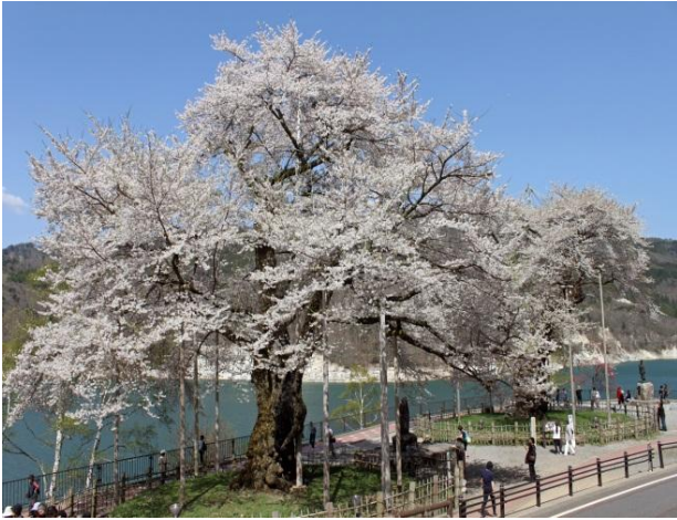
庄川桜（樹齢 500 年余）