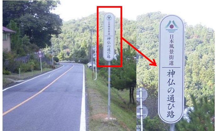
神仏の通ひ路ルートサイン