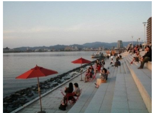
宍道湖夕日スポットでの湖水街道カフェ

また、パートナーシップの構成員を対象とした勉強会、モニターツアーの開催を行なうとともに、道路管理者と連携し、ガイドブックの作成やそれを使った、当地域を直接PRする活動等にも取り組んでいます。