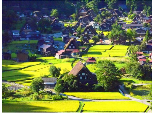
白川郷荻町合掌造り集落