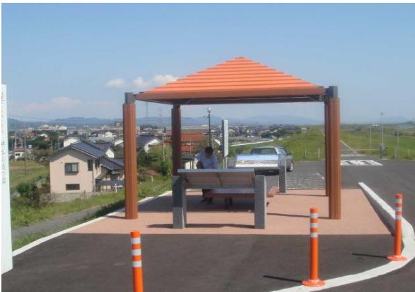
ビュースポット全景（西代橋）

ビュースポットにはそこから眺めることのできる景観と神話解説を付記した風景解説板を設置しています。