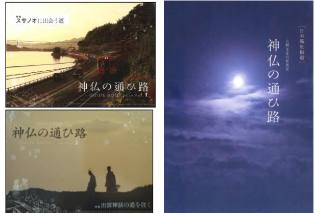
風景街道を紹介するガイドブック