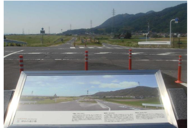
風景解説版（西代橋）