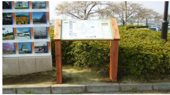
周遊ルート案内看板設置状況