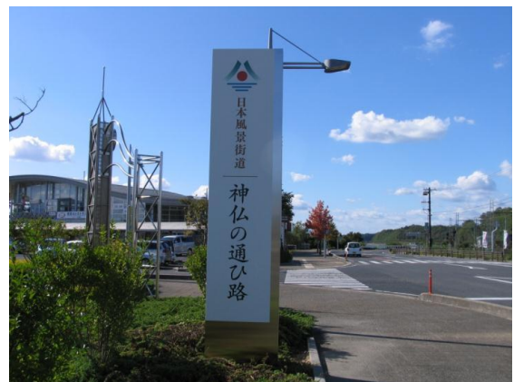
風景街道大型看板（道の駅「秋鹿なぎさ公園」）