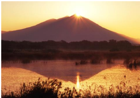
母子島遊水地 ※1 から望む筑波山

有識者や観光事業者等で構成された「筑波山ベストビューコンテスト実行委員会」の審査により、ベストビューポイント8箇所、ベストビュールート7路線、委員特別賞3地点が選定されました。