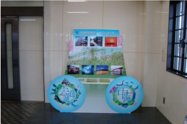
風景街道を紹介するブース（道の駅「湯の川」）