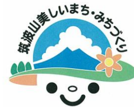
「筑波山美しいまち・みちづくり パートナーシップ」ロゴマーク

平成19年3月にロゴマーク選定会議において最優秀賞及び優秀賞(30点)を決定し、19年4月に表彰式を開催しました。