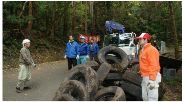
ルートの清掃活動の様子