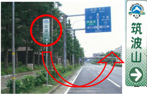
筑波山への誘導看板設置状況