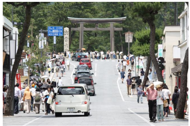
出雲大社前・神門通りのにぎわい

「水辺ルート」は中海・宍道湖の湖面や川面をかたわらに眺めながらの100kmのルートになります。車なら少しの時間で周遊は可能ですが、多くの景観スポットや湖に面したカフェやレストラン等も多く点在し、空と湖水、緑なす山脈などのロケーションを楽しめるルートになっています。