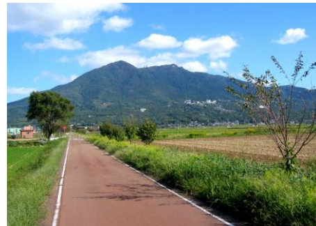
つくばりんりんロード ※2 と筑波山