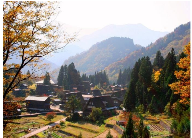
五箇山相倉合掌集落