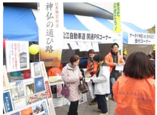
広島市で行われたイベントでのPR