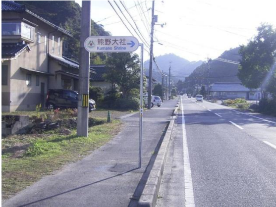
神仏霊場二十社寺のサイン

古事記編纂 1300 年、出雲大社の大遷宮などの県外客の来訪機会の増大に対応するため、平成 22 年度から平成 24 年度にかけて、登録ルート沿いに日本風景街道「神仏の通ひ路」の名称を付したサインを計 50 箇所設置すると共に、神仏霊場二十社寺や古事記、日本書紀、出雲国風土記等に登場する神話スポット等で案内標識がない場所 18 箇所についてサインを設置しました。