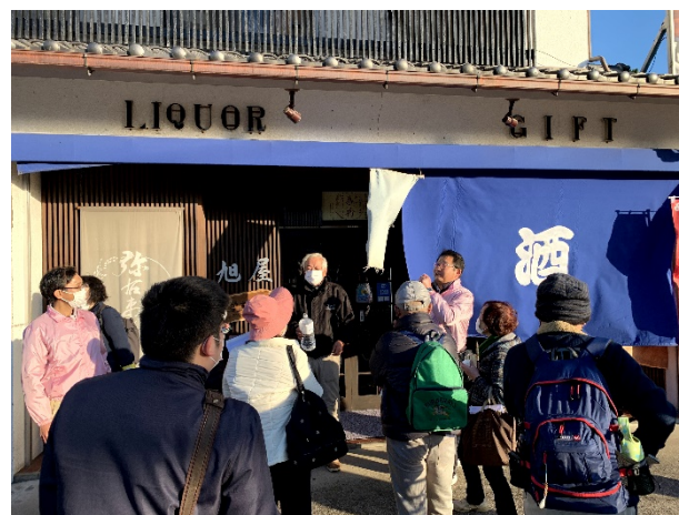
▲桑折町の味覚紹介の様子