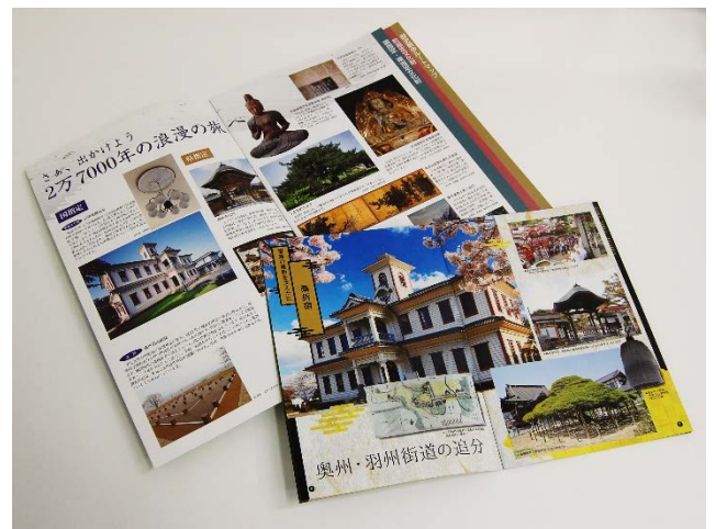
▲参加者に配布された桑折町の魅力を伝えるパンフレット

また、今回のツアー参加者には、桑折町の魅力が詰まったパンフレットもお配りしています。パンフレットでは、今回のルートで巡るスポットもありますが、その他の桑折町の魅力についてもご紹介しています。