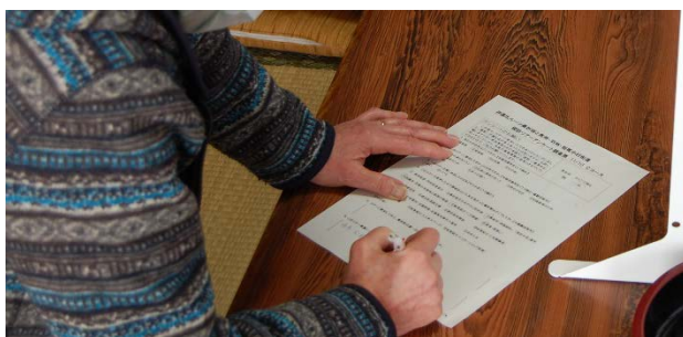
▲ツアー参加についてのアンケート