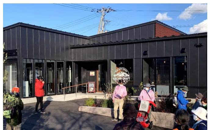
▲上町 CHEERS (ウワマチチアーズ)

地域のコミュニティースポット（飲食店）として令和 2 年 7 月にオープン。新しい魅力スポットとして紹介された。