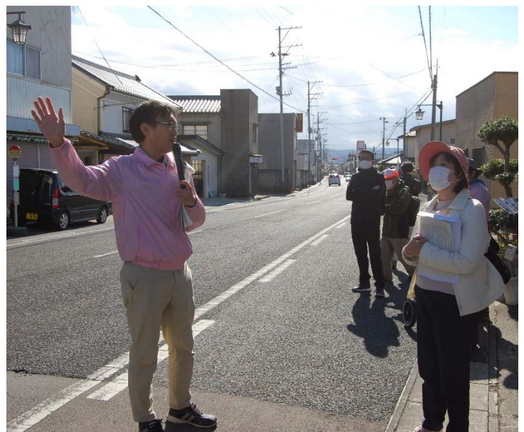
▲桑折町北木戸口跡「榊形」にて(現在は緩やかなカーブとなっている。)

昨年度までは、年5~7回程開催し、参加者も約120名(1回あたり約20名程度)お集まり頂いていましたが、今年は新型コロナウイルス感染防止のため、1回毎の参加者を12名と縮小しての開催となりました。