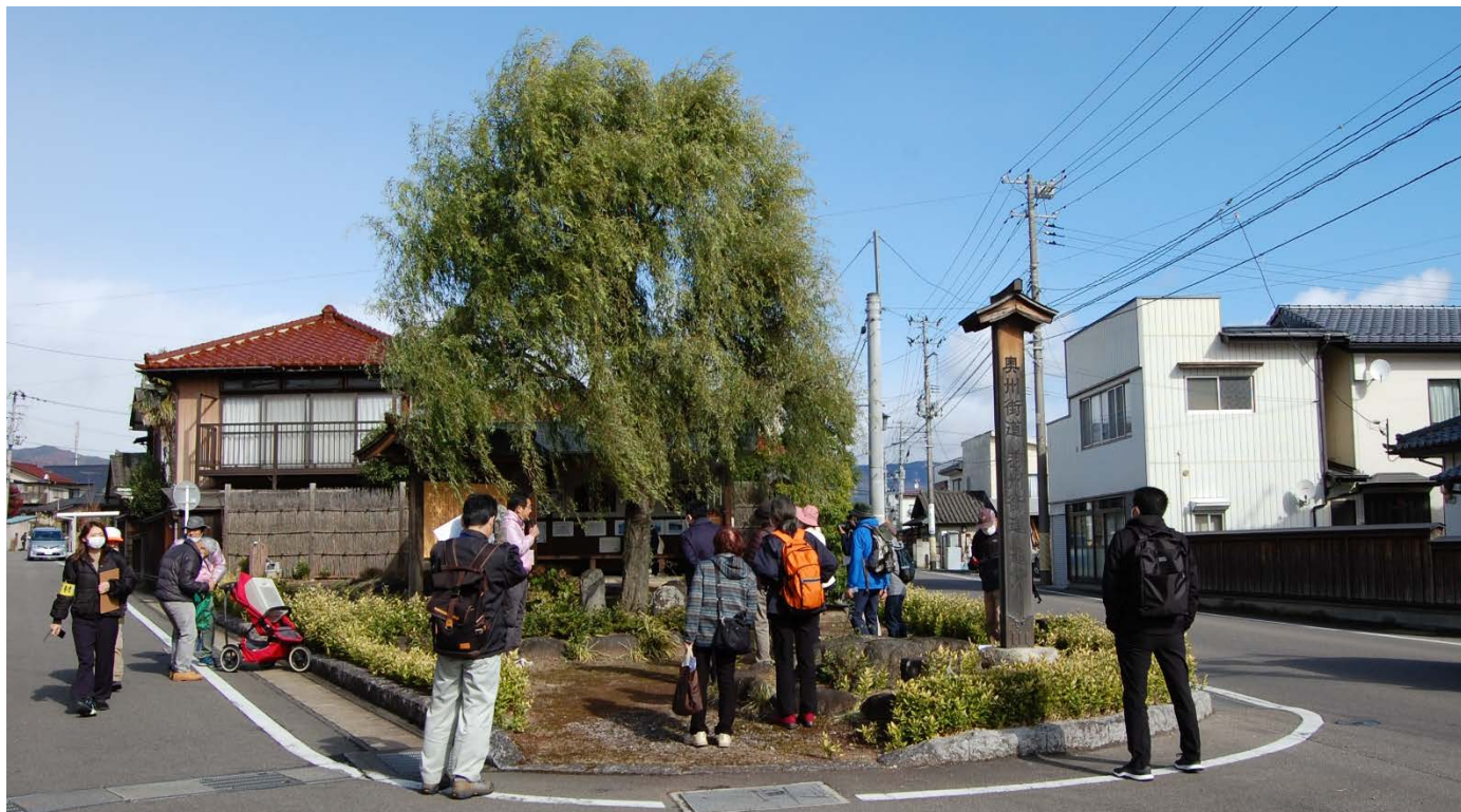
▲奥州街道・羽州街道分岐「追分」 右側の道路が「奥州街道」、左側の道路が「羽州街道」

JR 桑折駅から出発し、およそ 15 箇所の桑折宿の歴史に関するスポットを巡りました。ガイドは 2 人体制で、時には資料を使いながら桑折町の魅力について、丁寧に説明されていました。参加者の皆さんは、その説明を聞きながら、写真を撮ったり、配布されたパンフレットにメモを書き込んだりと理解を深めておられました。