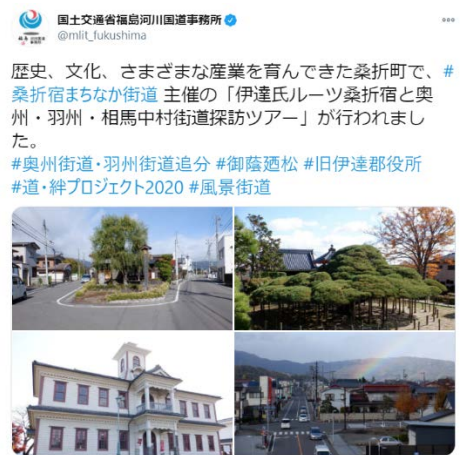
▲福島河川国道事務所 Twitter