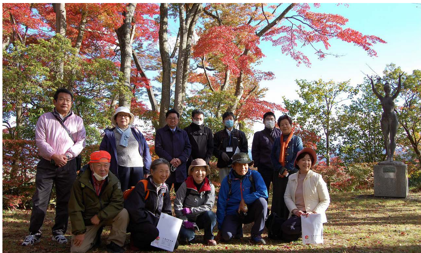
▲集合写真 奥州街道桑折宿の歴史と街並み探訪コースに参加された皆さん

このツアーは10月上旬から11月中頃までに桑折町を巡るA～Dの4つのコースが設定されています。今回ご紹介するのは、「奥州街道桑折宿の歴史と街並み探訪コース（Cコース）」です。