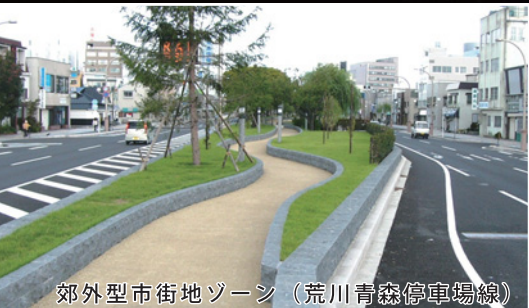
郊外型市街地ゾーン (荒川青森停車場線)