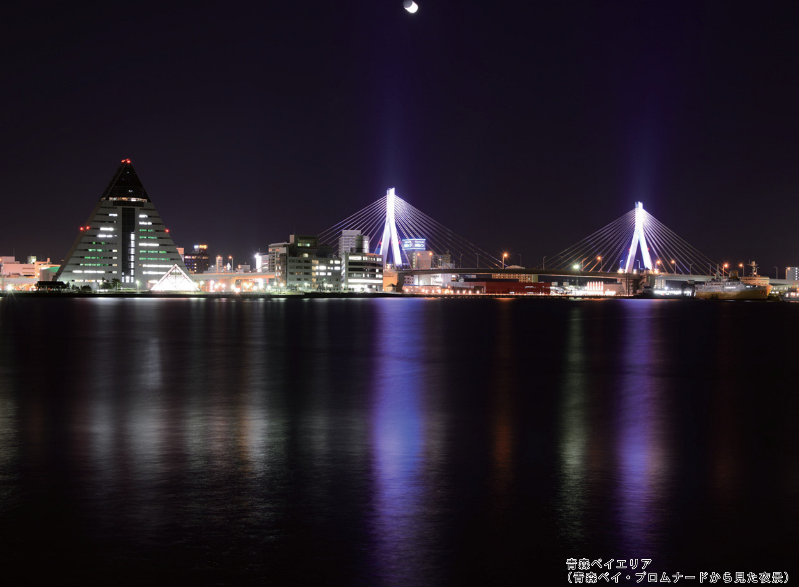
青森ベイエリア (青森ベイ・プロムナードから見た夜景)