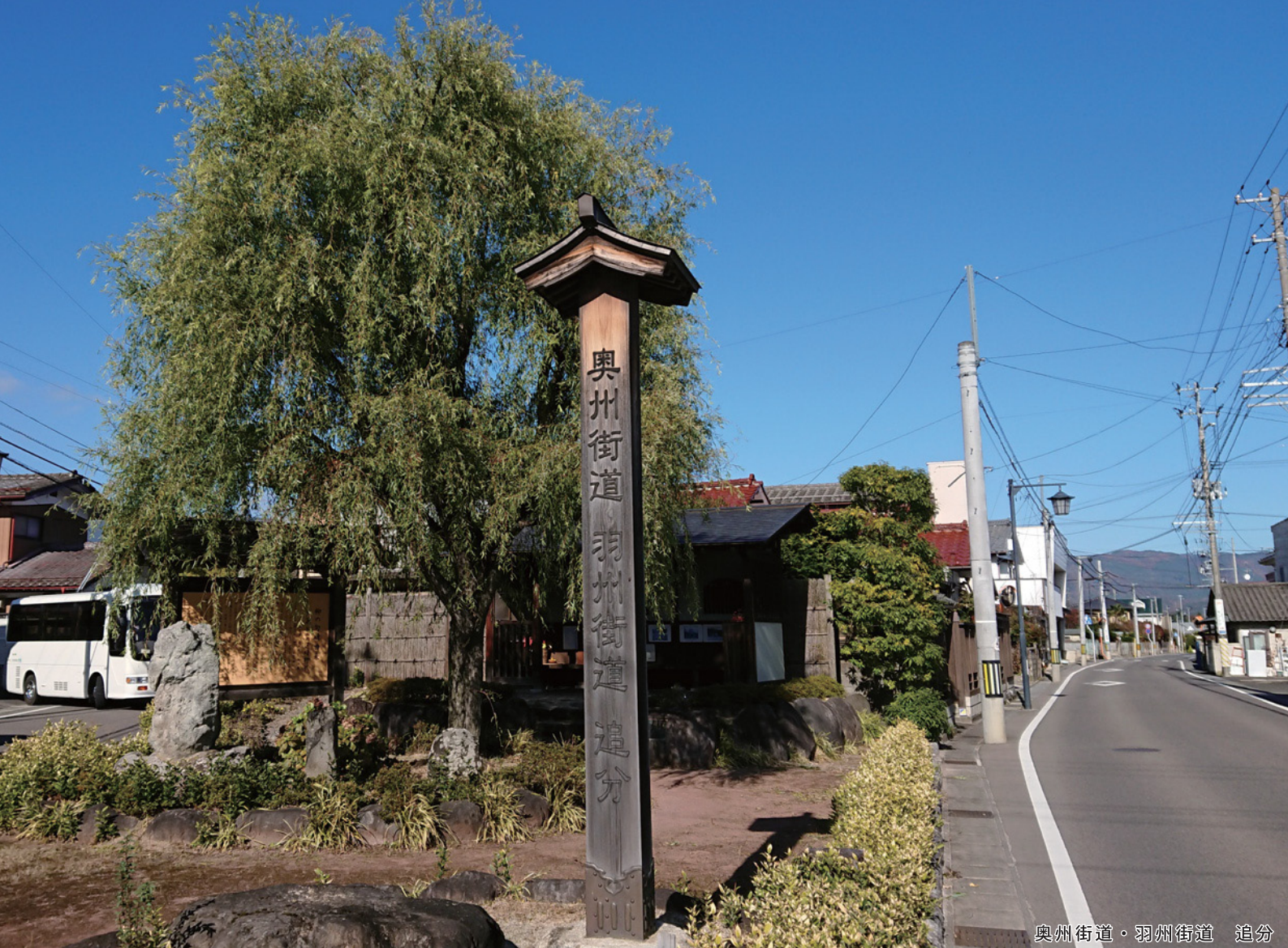
奥州街道・羽州街道 追分