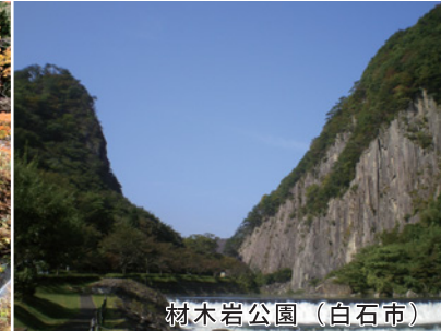
材木岩公園（白石市）