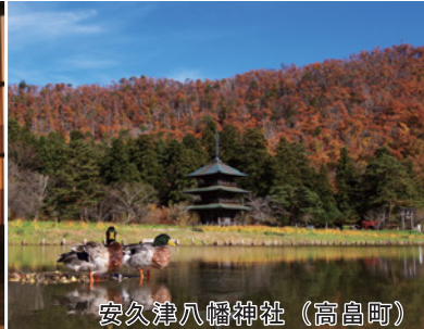
安久津八幡神社（高島町）