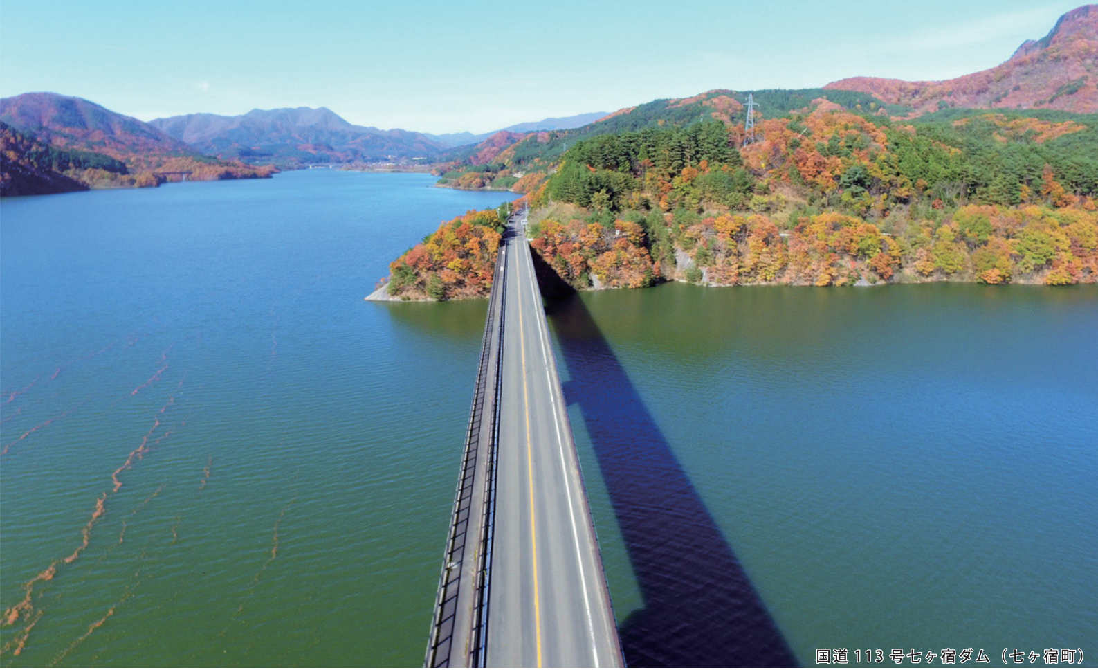
国道113号七ヶ宿ダム（七ヶ宿町）