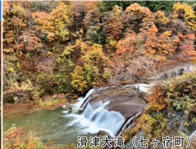
滑津大滝（七ヶ宿町）