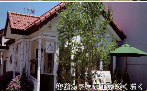
街道カフェ夢工房咲く咲く