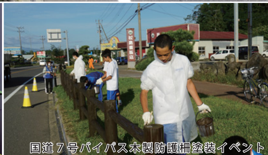
国道7号バイパス木製防護柵塗装イベント