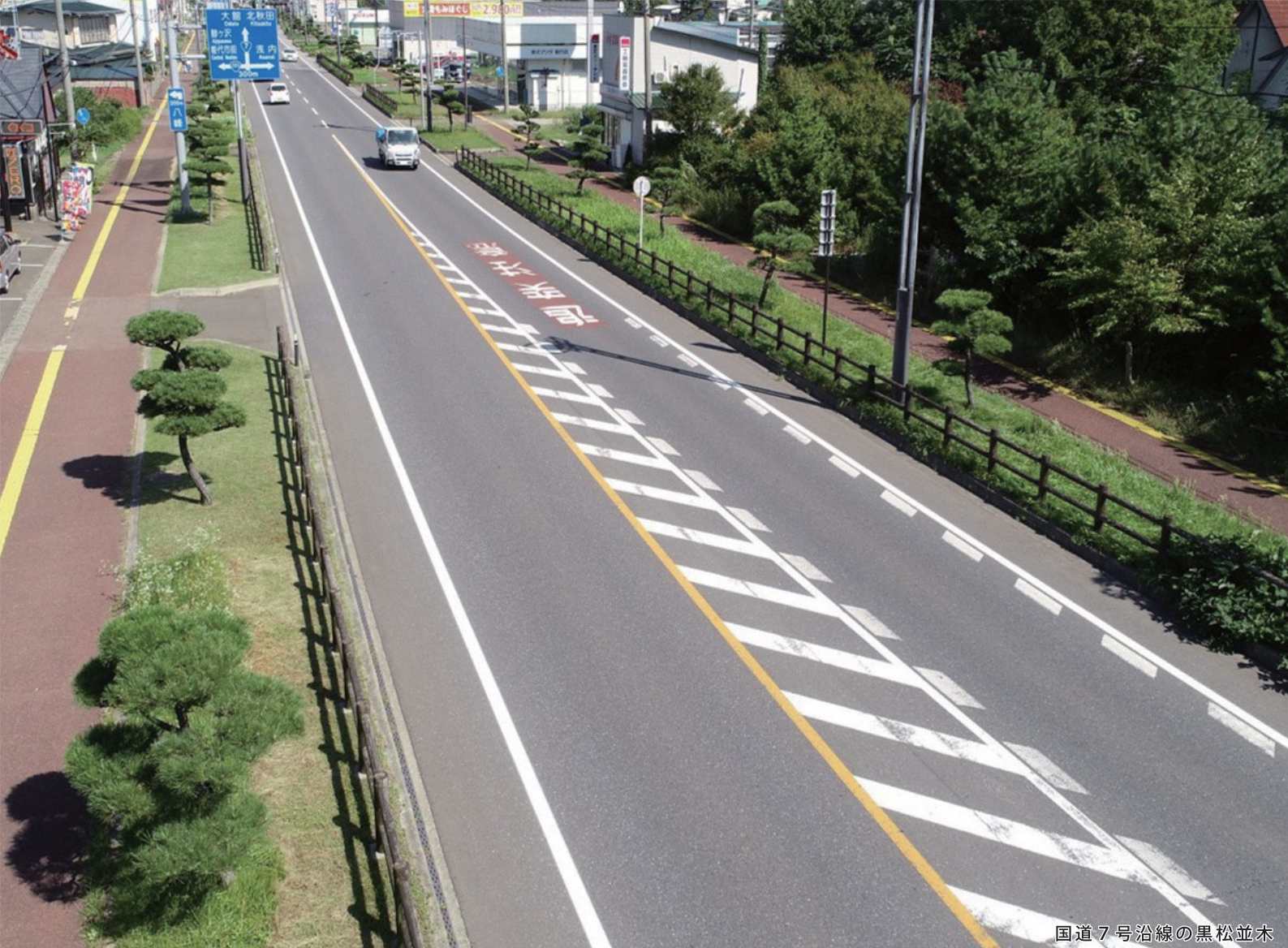
国道7号沿線の黒松並木