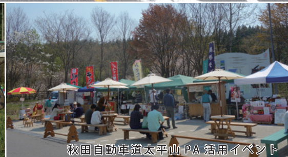
秋田自動車道太平山 PA 活用イベント