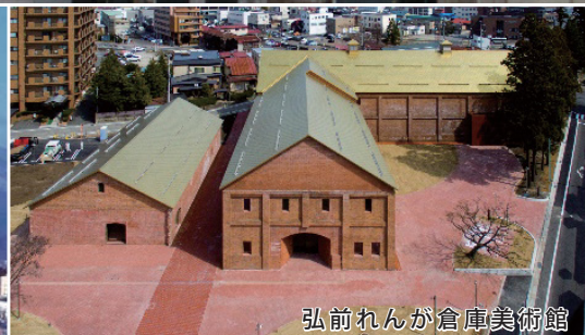
弘前れんが倉庫美術館