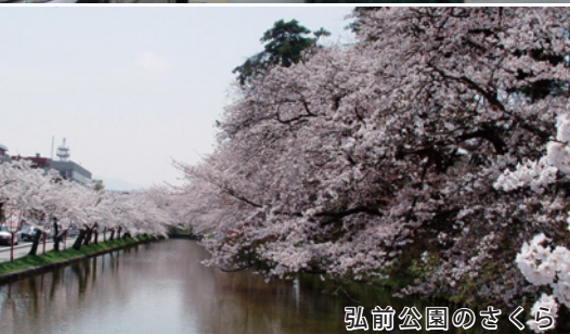
弘前公園のさくら