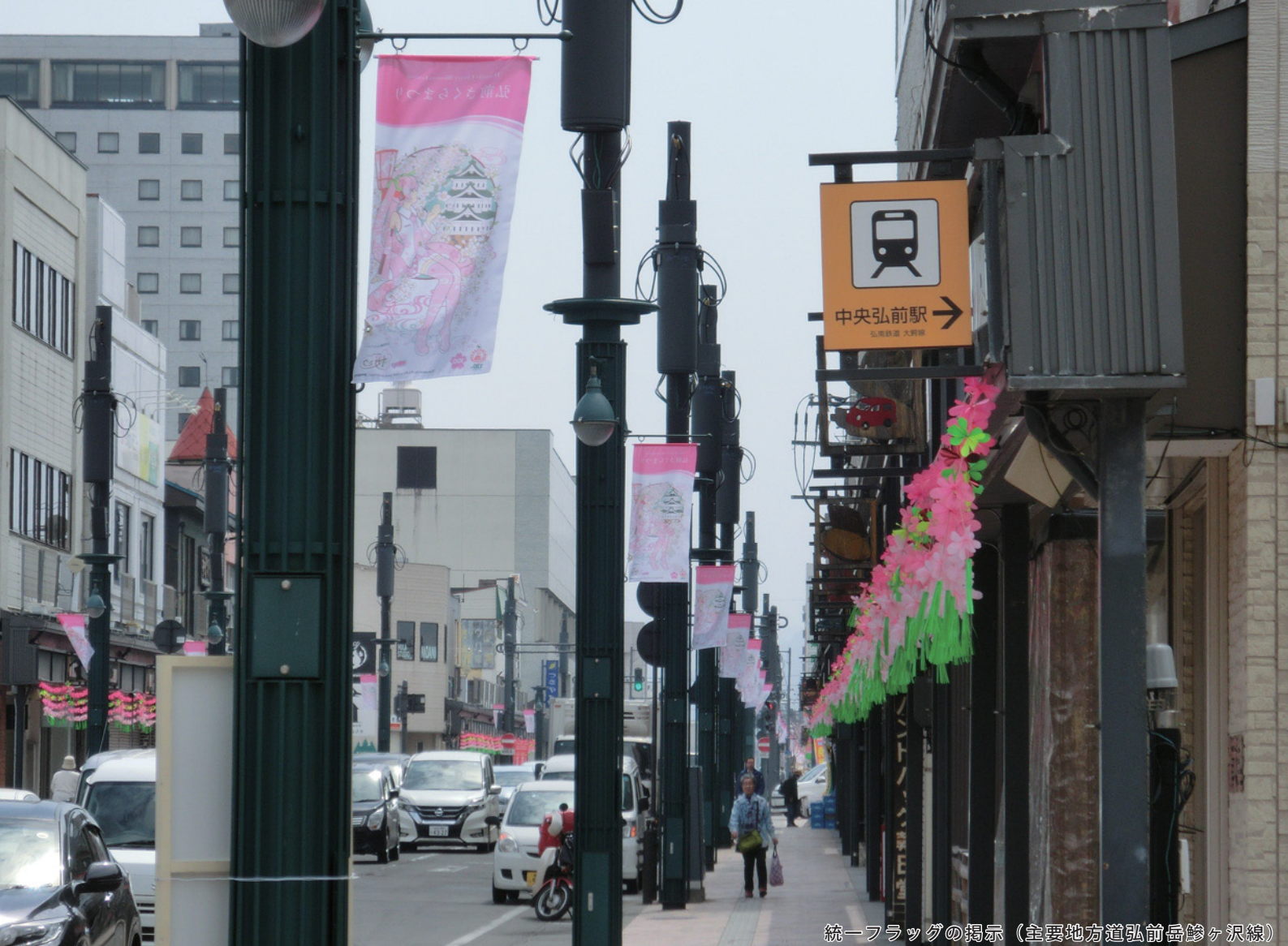
統一フラッグの掲示（主要地方道弘前岳野ヶ沢線）