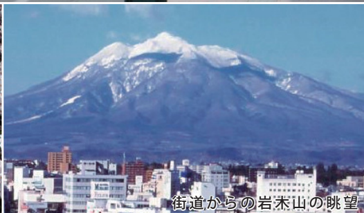
街道からの岩木山の眺望