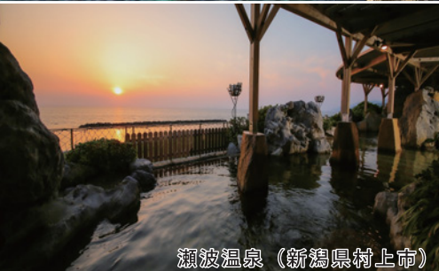
瀬波温泉 (新潟県村上市)