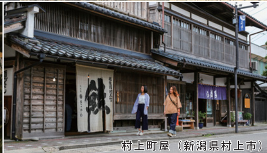
村上町屋 (新潟県村上市)