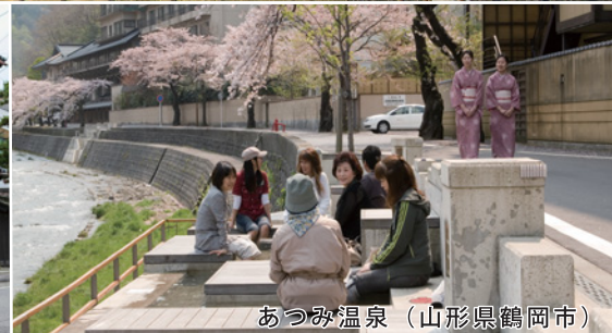
あつみ温泉 (山形県鶴岡市)