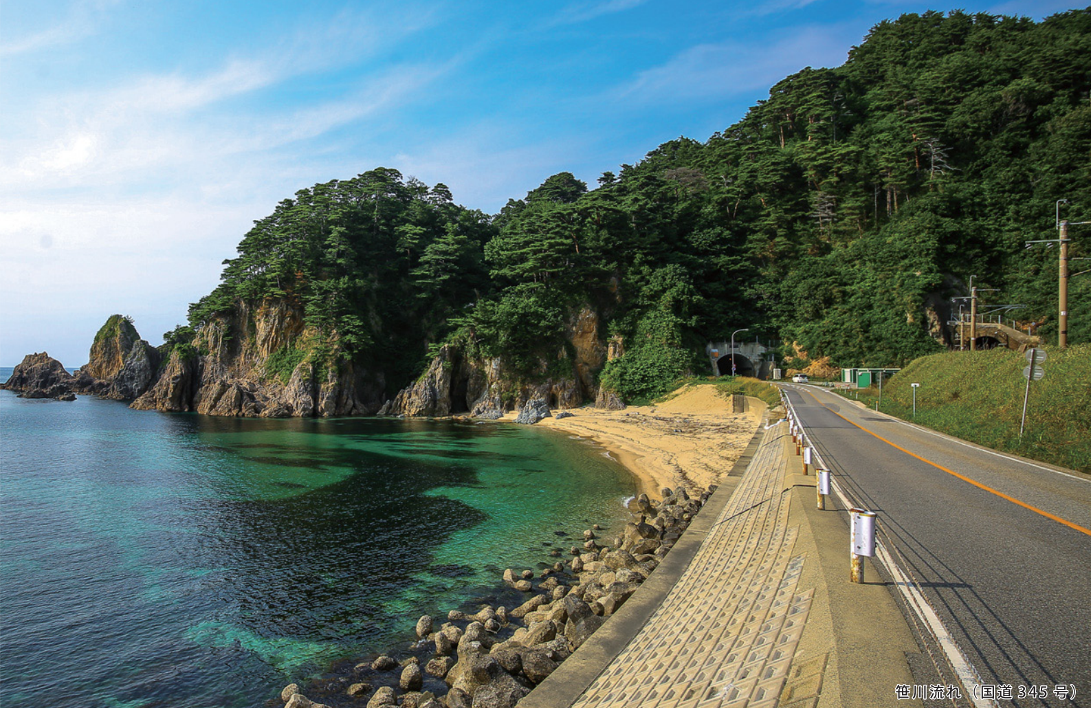
笹川流れ (国道 345 号)