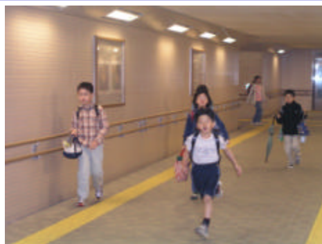
地下横断歩道通路内部