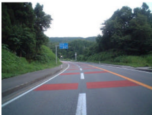
滑り止め・速度抑制舗装

平均勾配6.6%の急勾配、連続カーブ区間による事故が多発。 冬期では、路面凍結によるスリップ事故、大型車登坂不能による渋滞が発生。