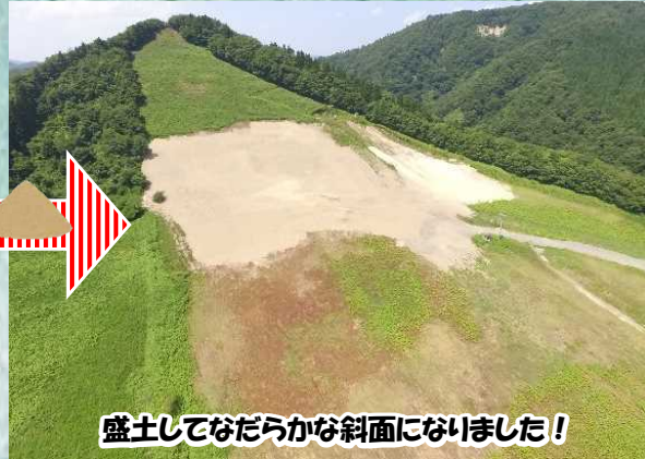
盛土してなだらかな斜面になりました！

鷹巣出張所管内の河川工事で発生した掘削土砂を北秋田市にある薬師山スキー場の凹地箇所に盛土して、山の斜面をなだらかにしました。より安全に滑れるようになりましたので、ぜひ今シーズンも改良した薬師山スキー場をご利用下さい！