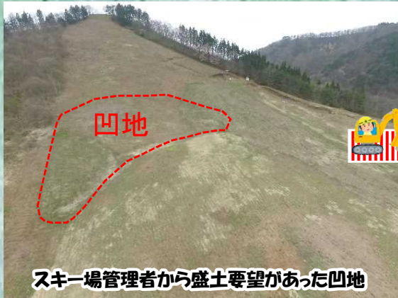
スキー場管理者から盛土要望があった凹地