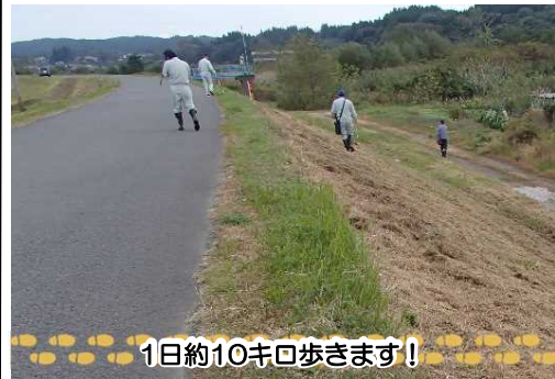
1日約10キロ歩きます！

今回の点検は、台風の多い時期に備え、堤防の安全性を確認するため、3日間にかけて鷹巣出張所管内全河川の堤防や高水護岸に変状や損傷がないか、徒歩で目視による点検を行いました。