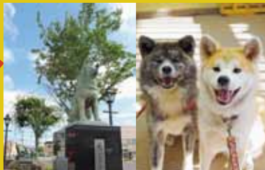
①駅前八手公銅像 ②秋田犬ふれあい処