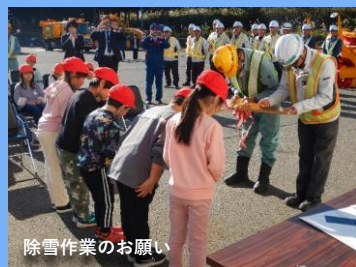
除雪作業のお願い