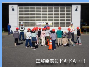
正解発表にドキドキ…!