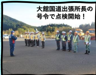
大館国道出張所長の号令で点検開始!