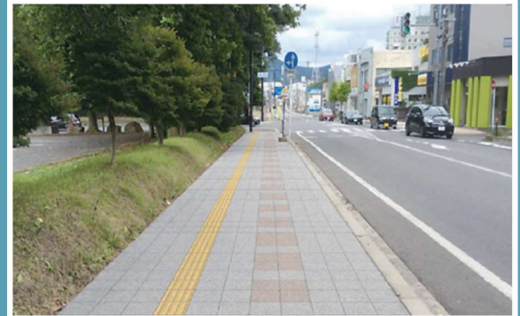
無電柱化後のイメージ(長倉地区)

また、大館市が推進している「 歴史まちづくり事業 」に基づき、大館城跡と周辺の街なみの 景観保全・景観に関する連携事業 として、 良好な都市景観の形成に向けたまちづくりを支援 します。