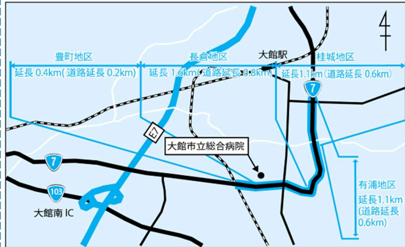
事業箇所の位置図