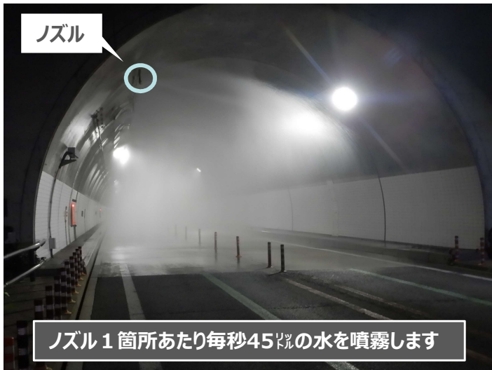
ノズル 1箇所あたり毎秒45ℓの水を噴霧します

10月3日(火)にトンネル内で車両火災の発生を想定した 水噴霧設備の操作訓練 を行いました。訓練には、能代河川国道事務所の他、大館・北秋田の両消防署、県警高速隊十和田分駐隊が参加し、 お互いの連携を確認 しました。