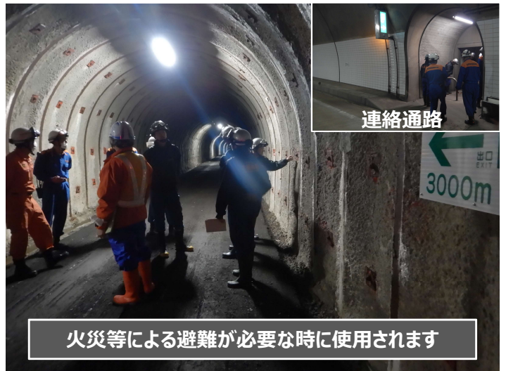
火災等による避難が必要な時に使用されます