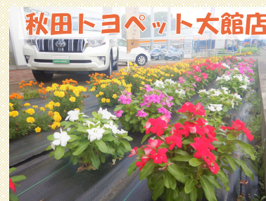
秋田トヨタ大館店