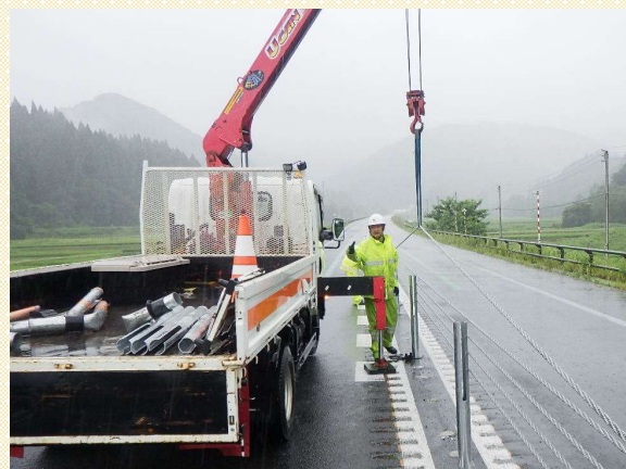
秋田道での事故処理