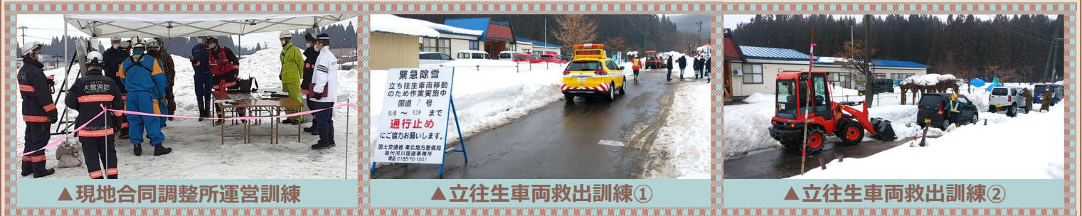
▲ 現地合同調整所運営訓練

当出張所からは各種訓練の中でも、 現地合同調整所運営訓練 と 立往生車両救出訓練 に参加しました。 現地合同調整所運営訓練 では、8つの関係機関からそれぞれ1～4名が参加し、 現地合同調整所の開設から関係機関と活動現場の調整と災害対策本部への報告まで を実施しました。また 立往生車両救出訓練 では、陸上自衛隊、大館市消防団、当出張所が参加し、 立往生車両の周辺の除雪、要救助者の搬送 を実施しました。いずれの訓練でも、迅速かつ的確に対応ができ、 関係機関の連携を確認 することができました。