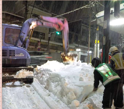
12月29日 19:58 夜間の排雪作業②