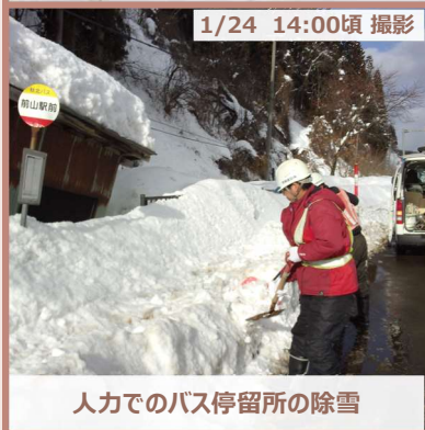
1/24 14:00頃 撮影