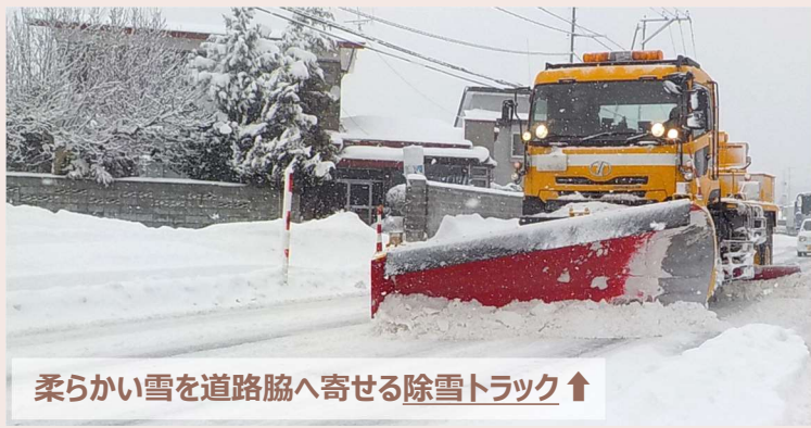
柔らかい雪を道路脇へ寄せる除雪トラック↑

国道7号の場合は家などが並んでいる街中の除雪作業になるので、道路の除雪に加え、歩道の除雪や排雪作業も重要になってきます。秋田道編で紹介した内容も振り返りながら、除雪機械について説明していきます。