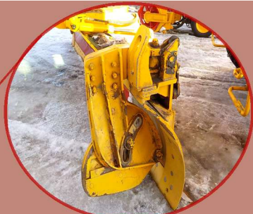
↑シャッターブレード拡大