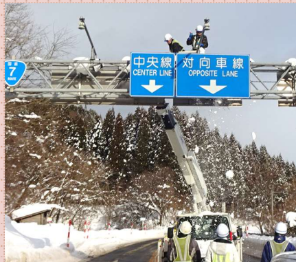
1月5日 14:28 標識の雪下ろし・氷柱撤去