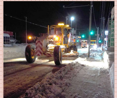
1月14日 22:53 夜間の除雪作業

こうして見てみると、日中はもちろん、夜の遅い時間帯もこんなに作業しているんですね。少し前まで家の前の歩道が雪の回廊のようになっていたのに、朝起きたらキレイに無くなっていてびっくりしました。それは夜間でも作業してくれる人たちがいるからなんですね。作業員の方々、いつも本当におつかれさます！