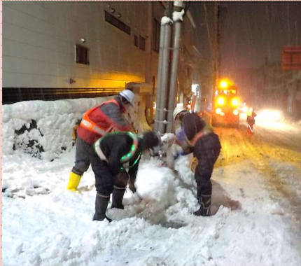
12月29日 19:57 夜間の排雪作業①

除排雪作業は、昼夜を問わず行っております。しかし、普段みなさんが夜間での作業や人力での作業現場を目にすることは少ないのでは？と思い、実際の作業風景を切り取ってみました！