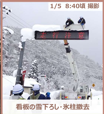
1/5 8:40頃 撮影