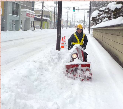
1月1日 14:39 ハンドガイドを使った人力での歩道除雪