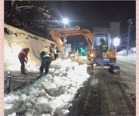
12月30日 22:48 夜間の排雪作業③