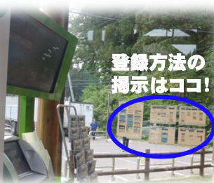
登録方法の 掲示はココ！

『道の駅SPOT』とは、 無料公衆無線LANを活用した、道路情報提供システム のことです。 今回は、H28.10.8から『道の駅SPOT』が導入された 道の駅やたて峠 で利用してきました！