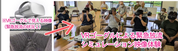
※VRゴーグルで見る映像（緊急放流の状況）