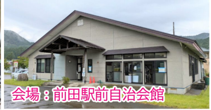
会場：前田駅前自治会館