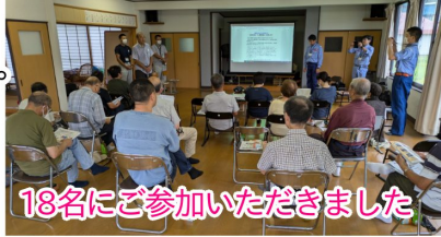
18名にご参加いただきました

9月15日（日）北秋田市前田駅前自治会を対象とした地域住民参加型の「ダム警報訓練」を実施しました。訓練では国交省から「緊急放流」や「洪水調節」についてVRゴーグル等を使って説明、北秋田市危機管理係から「水害からの避難」について説明したあと、緊急放流が想定される場合に市の防災ラジオや警報設備から流れる音声放送やサイレンを実際に聞いていただき、音の聞こえ方や内容について意見交換を行いました。