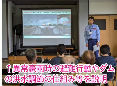
↑異常豪雨時の避難行動やダムの洪水調節の仕組み等を説明