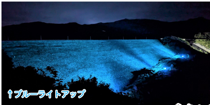
↑ブルーライトアップ

9月14日～17日に毎年恒例となった「お月見ライトアップ」を実施しました。期間中は晴れ間がなく仲秋の名月は厚い雲に覆われていましたが、ススキと月を見上げるウサギがお出迎えしていました。