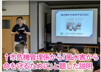
↑市危機管理係から「風水害から命を守るために」と題した説明