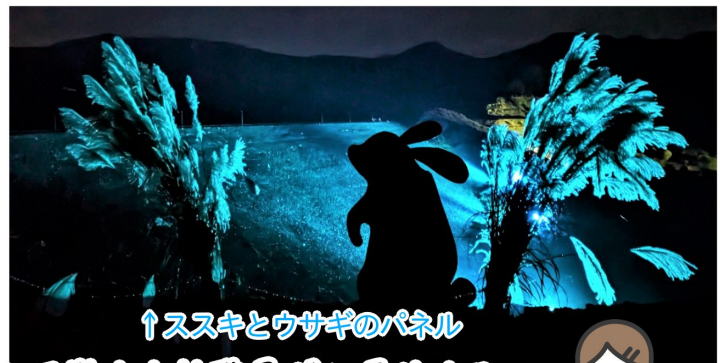
↑ススキとウサギのパネル