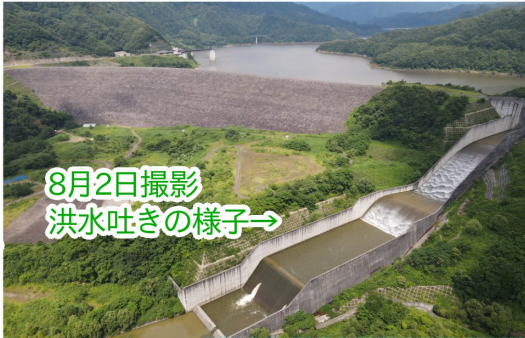
8月2日撮影 洪水吐きの様子→

森吉山ダムでは今回の洪水で25日22時～28日0時まで、容量にして約1,050万m 3 、東京ドームに換算すると、約8.4杯分の水を貯め込み下流河川の水位上昇を緩和しました。