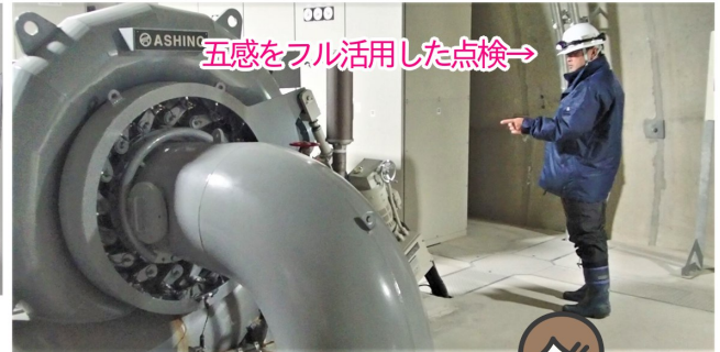
五感をフル活用した点検→

冬期間もダムの点検や巡視等が行われています。今回は「管理用発電機室」の点検を紹介します。管理用発電機はダムの水を利用し、設備に使用される電気を作っている正に心臓部。様々な計器を目視で確認するほか、異臭や異音がないかどうか、注意深く点検を行っています。