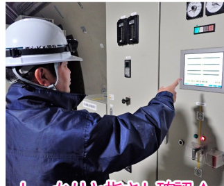
しっかりと指さし確認▲