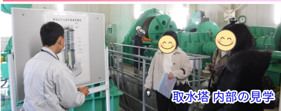
取水塔内部の見学