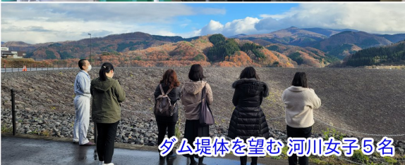
ダム堤体を望む 河川女子5名

河川女子（チーム米代）は、能代河川国道事務所に在席する女性職員で構成されたチームです。働く職場や現場のレポートをホームページで不定期に更新されています。今回は森吉山ダムをテーマとして取材していただきました。記事公開が楽しみです！