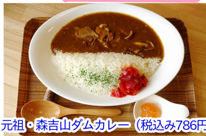
元祖・森吉山ダムカレー (税込み786円)

ダム広報館内で土日限定の営業をしている「喫茶ねもりだ」の営業日は残すところ4日となりました。6日(土)、7日(日)、13日(土)、14日(日)です。ダムカレーの食べ納めには是非お越しください。なお、ダム広報館は12月1日(水)から冬期休館となります。