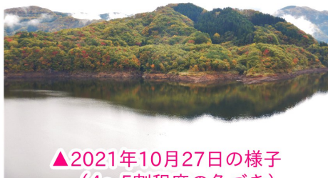
▲2021年10月27日の様子 (4～5割程度の色づき)

オススメの鑑賞スポットはダム管理支所の展望デッキから。時間帯は夕方がイチオシです。夕日を浴びた紅葉は美しすぎますよ～！