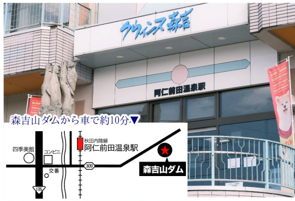
森吉山ダムから車で約10分