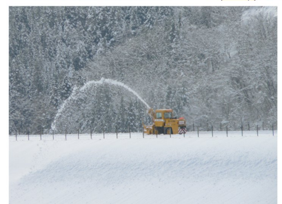
また雪が降るまで、しばしのお休み 雪を吹き上げる姿が可愛くみえます (12月)

『ロータリー除雪車』の稼働が無事に終わりました。今冬は一度に降る雪の量が多く、1回の除雪時間も長くかかっていましたが、3月に入るとピタッと降らなくなりました。そろそろ自家用車のタイヤ交換したいのですが、ダム周辺はまだ雪が多く、日中とけた雪が夜凍ることも考えられるので慎重に検討したいと思います。