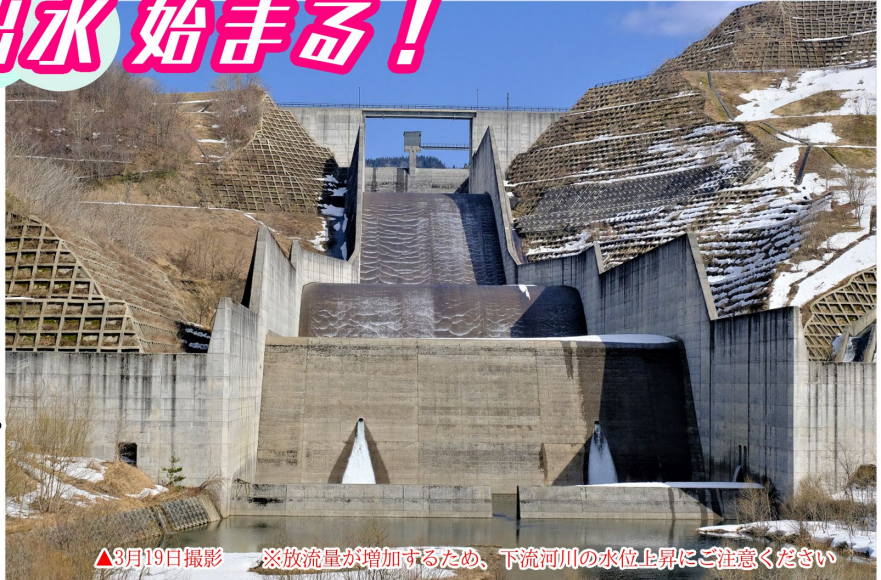
▲3月19日撮影 ※放流量が増加するため、下流河川の水位上昇にご注意ください

今だけ、早春の雄大な景色です。道路の雪も消えていますので、ぜひ近くでご覧ください。