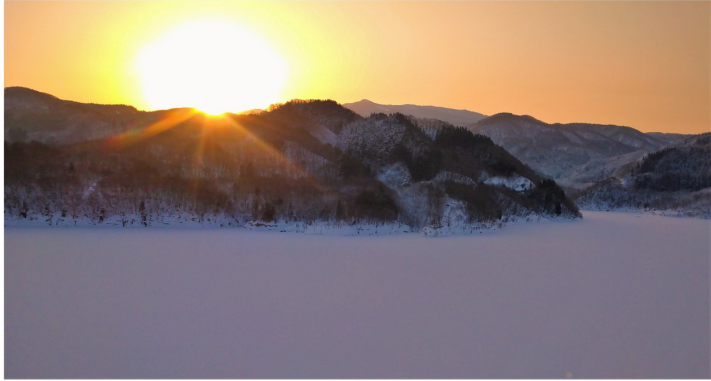
快晴の朝焼け。森吉山と四季美湖の色あい1秒ごとに変化していきます。

遠くへ出かけたくても、なかなか出歩けない日々が続いています。ここでは少しのコーヒーマイクとして職員K.S.さんがこの冬に撮りためた写真の中から、とっておきの2枚をご紹介します！