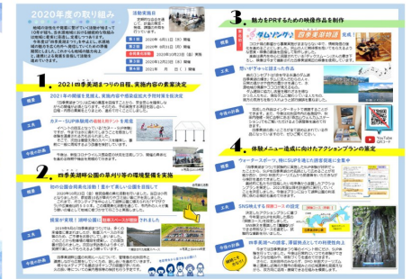
▲ 2020年度 四季美湖ネット森吉山 活動報告書 (4月以降、ダム広報館等でご覧いただける予定)