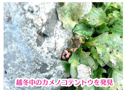
越冬中のカメノコテントウを発見

「気温10度超え」のおだやかな陽気に誘われ、堤体の上を歩いてきました。空は真っ青、湖面は一面真っ白で最高のロケーションです。澄んだ空気のなか『コンコンコン』と軽快なリズム音が辺りに響いています。ドラミングと呼ばれ、縄張りを示すため、キツツキが木を素早く叩いて鳴らす行動で、求愛の意味もあると考えられているそうです。春が近いことを鳥が教えてくれました。