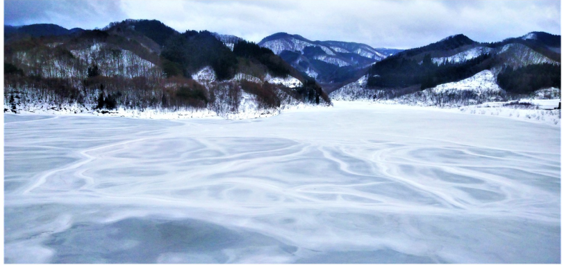
雪や風、様々な気象条件によって表情を変える湖面の文様。天然のアート作品です。