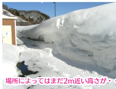
場所によってはまだ2m近い高さが・・・