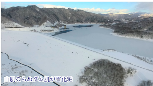
山肌ならぬダム肌が雪化粧

晴れ間は一瞬で、シャッターチャンスだと思って外に出てみても、あっという間に雲が出てきます。この時期の青空とダムの写真は貴重な風景です。