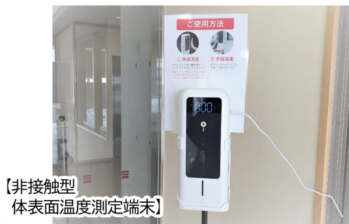
【非接触型】 体表面温度測定端末