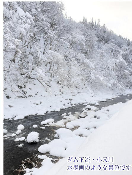
ダム下流・小又川 水墨画のような景色です