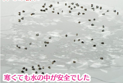
寒くても水の中が安全でした