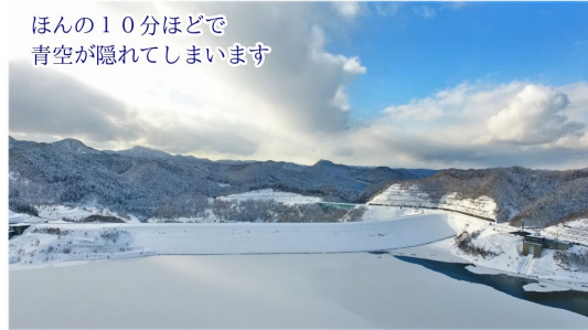
ほんの10分ほどで 青空が隠れてしまいます