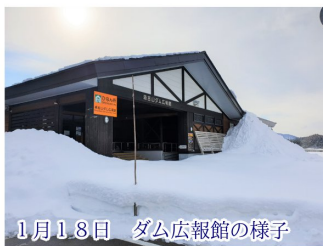
1月18日 ダム広報館の様子

それは何故かとグラフをよく見てみると、年末から年明けにかけ1週間で約60cmの積雪があったことが分かりました。これは過去2番目の多さです。更にダムサイトの平均気温は観測開始から最も低くなっており、厳しい冬を裏付けるものでした。