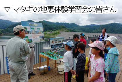
▽ マタギの地恵体験学習会の皆さん