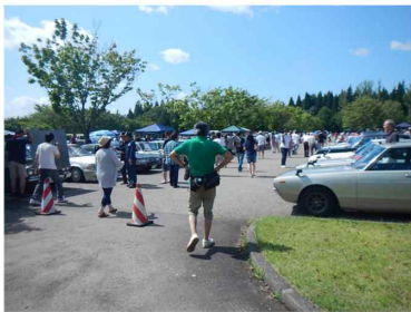
△ 往年の名車が勢揃い