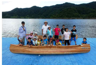
△ 約1時間の体験でした