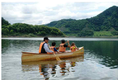
△ 声をかけてリズムを合わせます