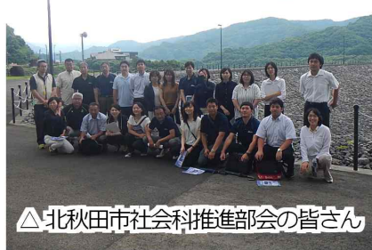
△ 北秋田市社会科推進部会の皆さん

8月19日（土）マタギの地恵体験学習会に参加された皆さんはカヌー体験前にダム見学もしていただきました。森吉山ダムへお越しいただき、ありがとうございました！