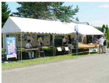
△ ビジョンの活動をPR