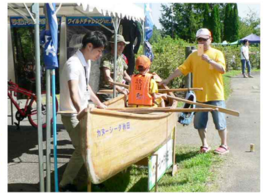
△ カヌーに乗って記念撮影