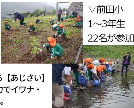
▽前田小 1~3年生 22名が参加

6月23日(金) 森吉四季美湖を守る会が前田小学校と共同で実施している「未来まで四季美湖に桜を残そうプロジェクト」が今年もダム湖畔・様田地区で行われました。桜の手入れの他、北秋田市の市花でもある【あじさい】を60株植樹。植樹の後は、阿仁川漁協の協力でもイワナ・ヤマメ・サクラマスを計2万匹放流しました。