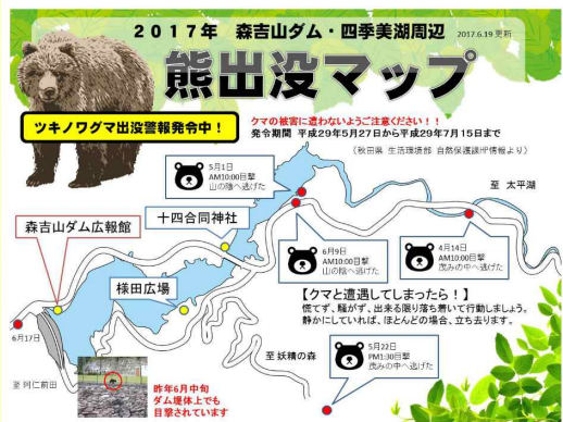
△ 森吉山ダム広報館に掲示中です

ダム周辺だけではなく、秋田県内全域でクマの出没が確認されています。昨年は5~6月にかけ、人身事故が集中して発生しています。これからの時期、クマの繁殖行動や親子グマの出没等に注意が必要です。山での活動には十分に注意するとともに、目撃情報マップをご活用ください。