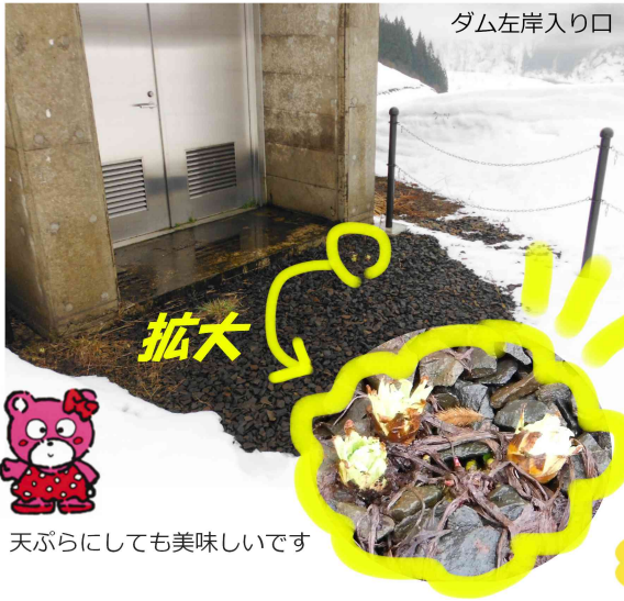
天ぷらにしても美味しいです

発行者：国土交通省 東北地方整備局 能代河川国道事務所 森吉山ダム管理支所 〒018-4512 秋田県北秋田市根森田字姫ヶ岱31 TEL:0186-60-7231 FAX:0186-60-7232 http://www.thr.mlit.go.jp/noshiro/