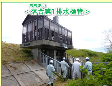
施設周囲の異状の有無を確認