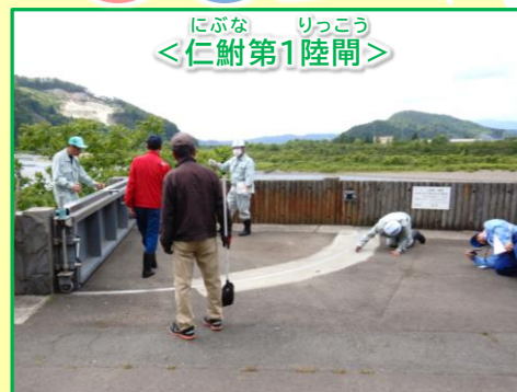
ゲートの開閉状況を確認