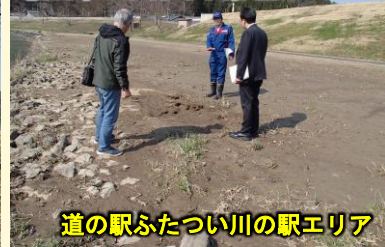
道の駅ふたつ川川の駅エリア