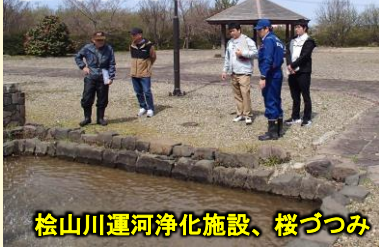
松山川運河浄化施設、桜づつみ