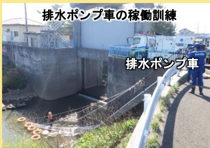
排水ポンプ車の稼働訓練