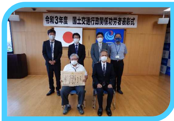
建設事業関係功勞者