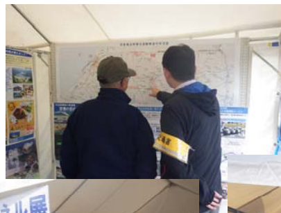
← 道路事業の説明を 求める来場者(関心の高 かった日治道パネル)