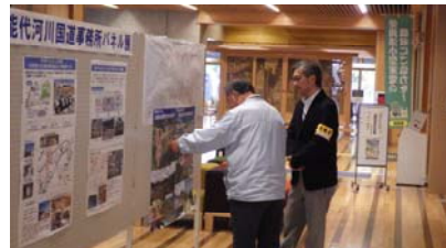
← 道路事業の説明を 求める来場者