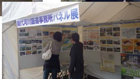
→ 河川パネル(防災ステーションの整備)に関心を 示す来場者