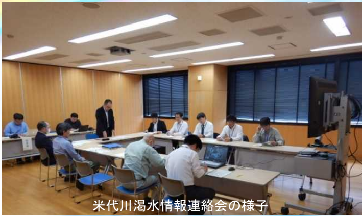
米代川湧水情報連絡会の様子

5月31日、国や県、流域自治体による「米代川湧水情報連絡会」が能代河川国道事務所で開かれました。今年は少雪だったことから、5月以降は平均湧水流量を下回ることを共有しました。湧水が続くと農業用水を確保できなくなる事があります。しかし、参加機関の担当者によると、「29カ所のため池の貯水状況に営農の支障は無く、田植え作業は開始時期や進捗率も平年並み」ということです。