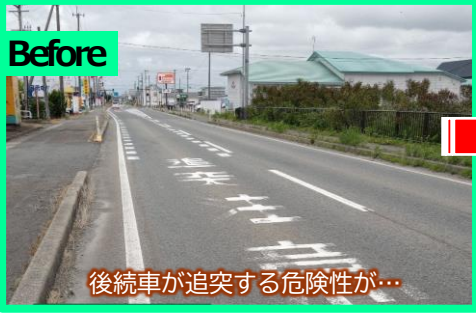
後続車が追突する危険性が…