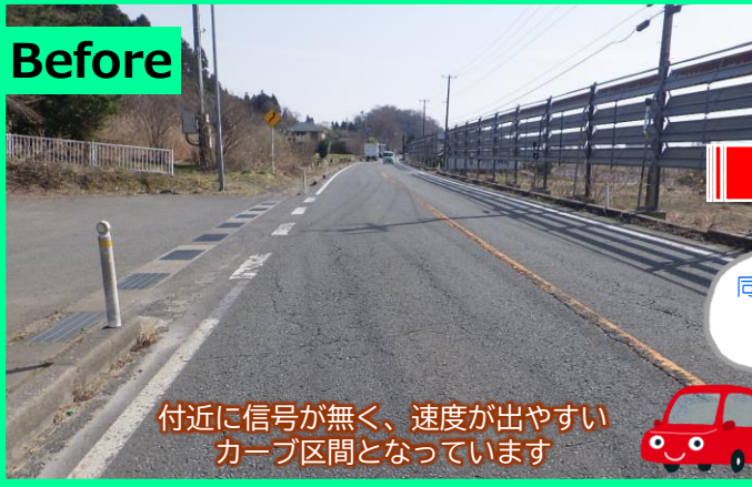
付近に信号が無く、速度が出やすいカーブ区間となっています

管内では、事故危険箇所の事故防止対策として、路面表示や看板を設置して注意喚起を行っています。 今年は新たに 国道7号三種町天瀬川地内 で 注意喚起路面表示 と 減速路面表示 を設置しました。