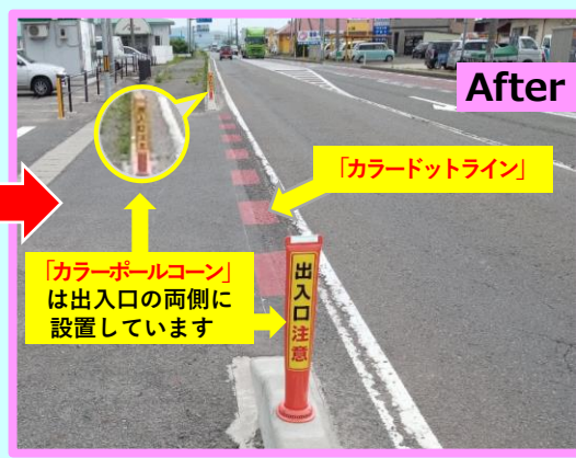
沿道施設への出入口が気付きにくい…