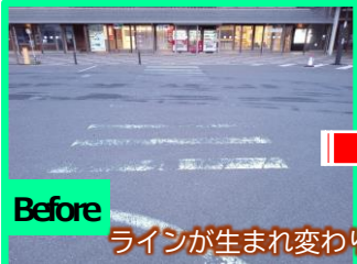
ラインが生まれ変わり、目立っていますね！