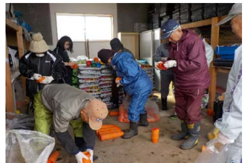
【第1回目作業の様子】トレイへ土詰め → 種蒔き(サルビア・百日草)・水かけして熱線台へ → 移植用のポット仕分け