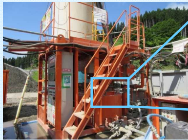
ミキシングプラント