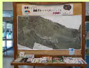
立体空中写真コーナー

人が物体を立体的に見ることができるのは、1つの対象物を左右に離れた両目で見る際の見え方の違いによるものです。