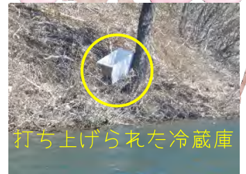
打ち上げられた冷蔵庫