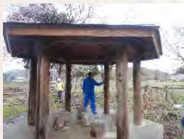
錦秋湖川尻総合公園