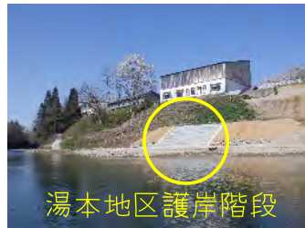
湯本地区護岸階段

今年度初回は4月22日に実施しました。ダムの維持管理に支障となる漂着物等がないか確認しました。