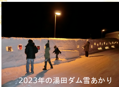
2023年の湯田ダム雪あかり