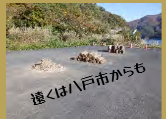
遠くは八戸市からも