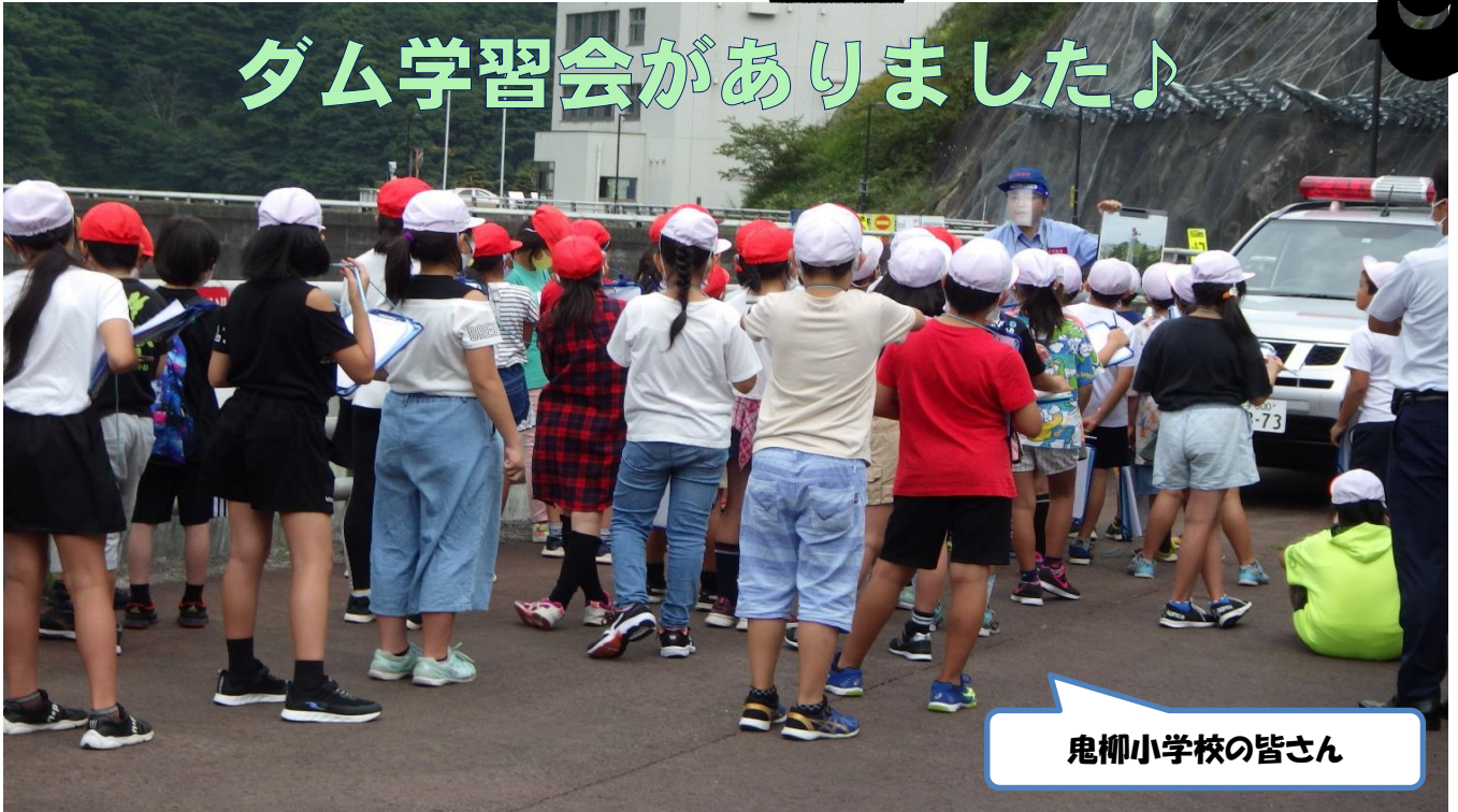
鬼柳小学校の皆さん

コロナウイルス感染防止の為、しばらくダム見学はお休みしていますが、この度、9月17日(木)鬼柳小学校4年生51名をスタートに、9月30日(水)に江釣子幼稚園の年長さん33名、10月2日(金)に湯本保育園年中さんから年長さん18名、10月6日(火)は東和中学校1年生49名がダム学習に来てくれました！