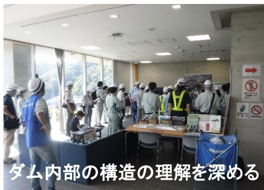
ダム内部の構造の理解を深める

今回、UAV(ドローン)による監査廊内の遠隔飛行による点検を行うことにより、管理の効率化についての可能性を検証しました。