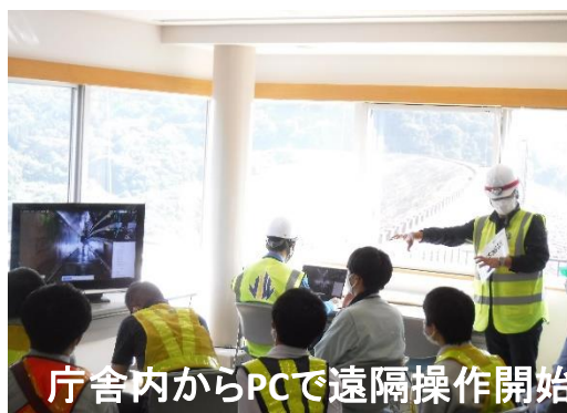
庁舎内からPCで遠隔操作開始