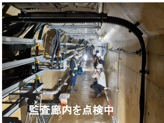
監査廊内を点検中