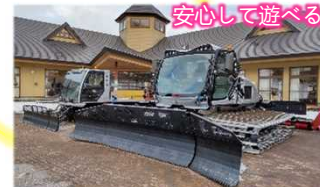
安心して遊べるよう