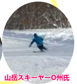
山岳スキーヤーO州氏