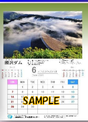
《胆沢ダムは6月のカレンダーに掲載》