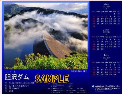
《胆沢ダムのPC用壁紙》