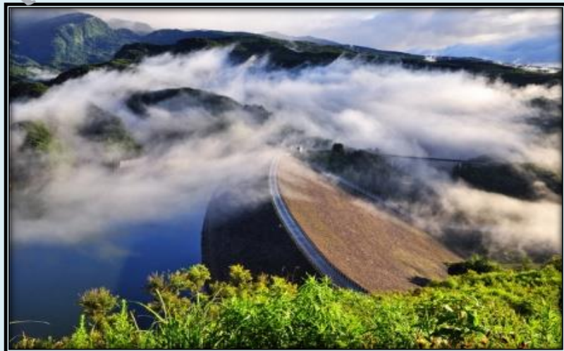
岩手県 胆沢ダム

◆ (一財)ダム技術センターのフォトコンテストで、応募総数450点の中から、奥州市在住の蜂谷福夫さんがみごと「最優秀賞」に輝きました！！一昨年に続く2度目の快挙となりました。おめでとうございます！！