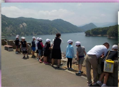
6月14日 奥州市立藤里小学校