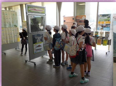
6月14日 奥州市立真城小学校