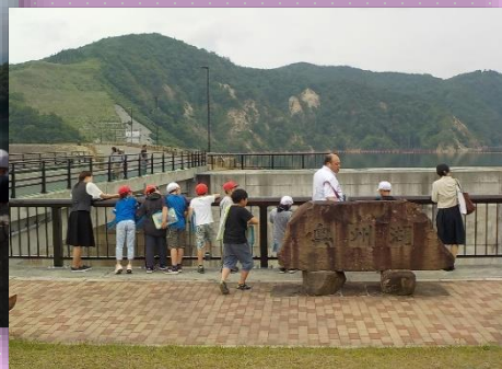
6月19日 奥州市衣里小学校