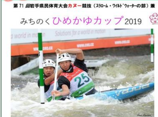
第71回岩手県民体育大会カヌー競技(スラローム・ワイルドウォーターの部)兼