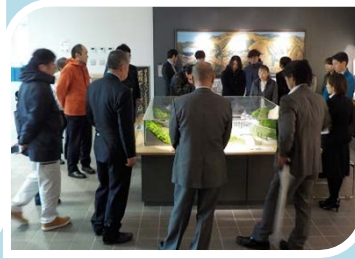
11/21土地改良総務担当者協議会