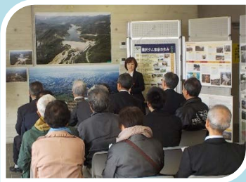
11/7行政相談委員一関地区協議会