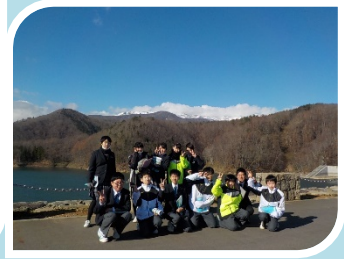
11/26奥州市立胆沢中学校

今年もたくさんの皆様に、胆沢ダムの見学会にお越し頂きました！ありがとうございました♪ 今後も、より分かりやすくお伝え出来るよう工夫して参ります。 なお、胆沢ダム管理支所の展示室は、年中無休で開館しております。（開館時間 9時～17時） 自由見学については、申込不要です。皆さまのお越しをお待ちしております！ スタッフによる説明は、事前申込が必要です。申込は、随時受け付けております。 詳しくは管理支所まで、お気軽にお問い合わせください♪ 問合わせ先：胆沢ダム管理支所 電話0197-49-2981（平日 9時～17時）