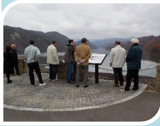
11/8佐倉河地区館長協議会