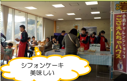
岩ダム・カフェの様子