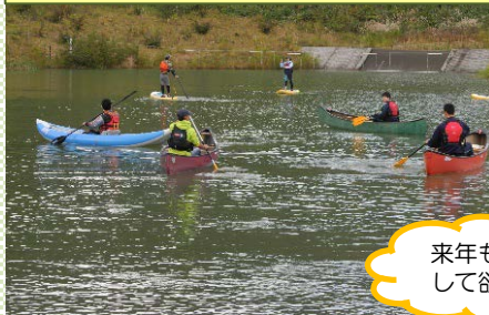
カヌー・SUP体験会の様子