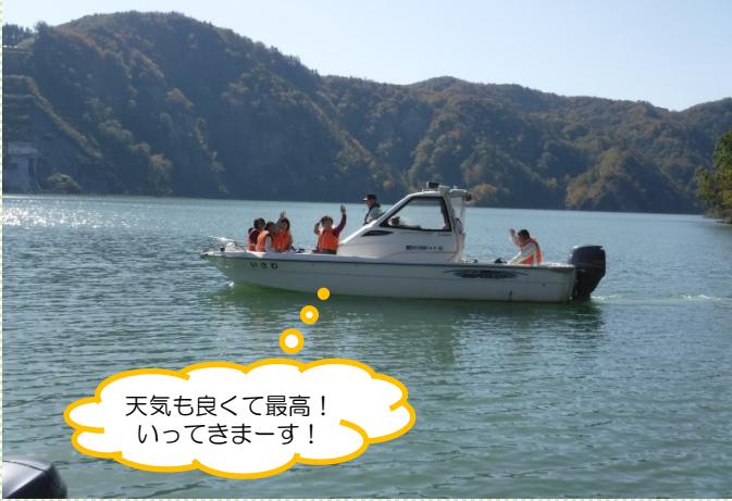
湖面巡視体験会の様子