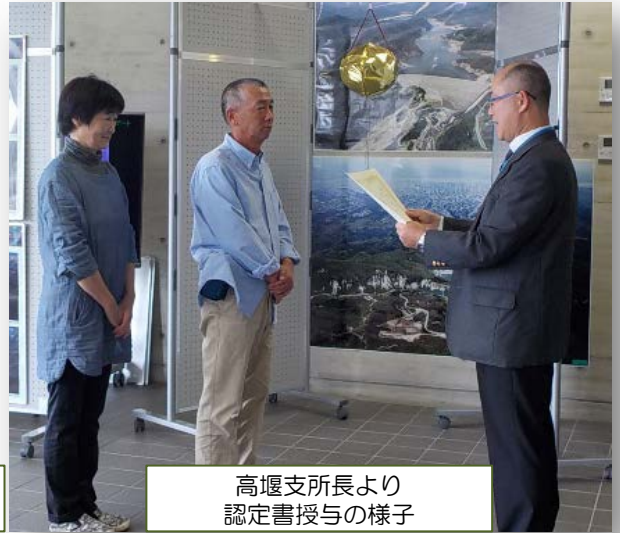
高堰支所長より認定書授与の様子