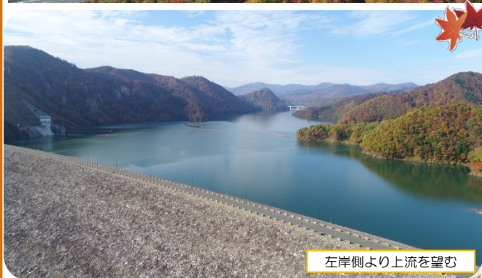
左岸側より上流を望む