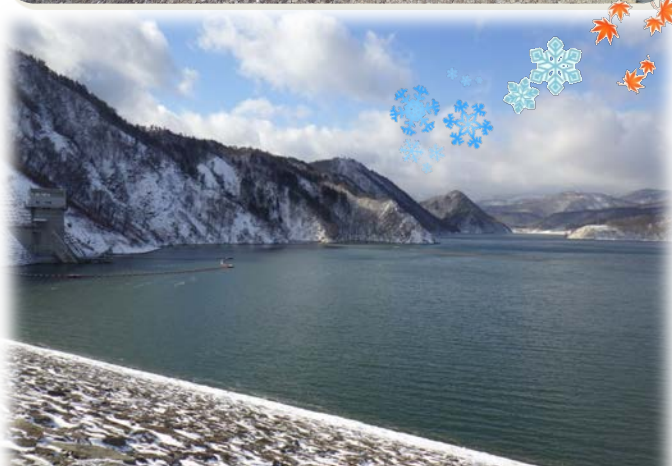
天端から右岸上流側を望む（11月20日撮影）