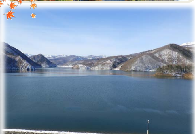
天端から上流を望む（11月22日撮影）